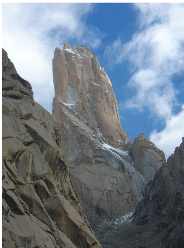
Trango Nameless Tower

Zwracam się z prośbą do Szanownej Komisji Wspinaczki Wysokogórskiej PZA o dofinansowanie mojej wyprawy w Karakorum na Trango Tower w 2012 roku. Celem wyprawy będzie zdobycie Trango drogą Słoweńska – klasycznie, w stylu alpejskim.