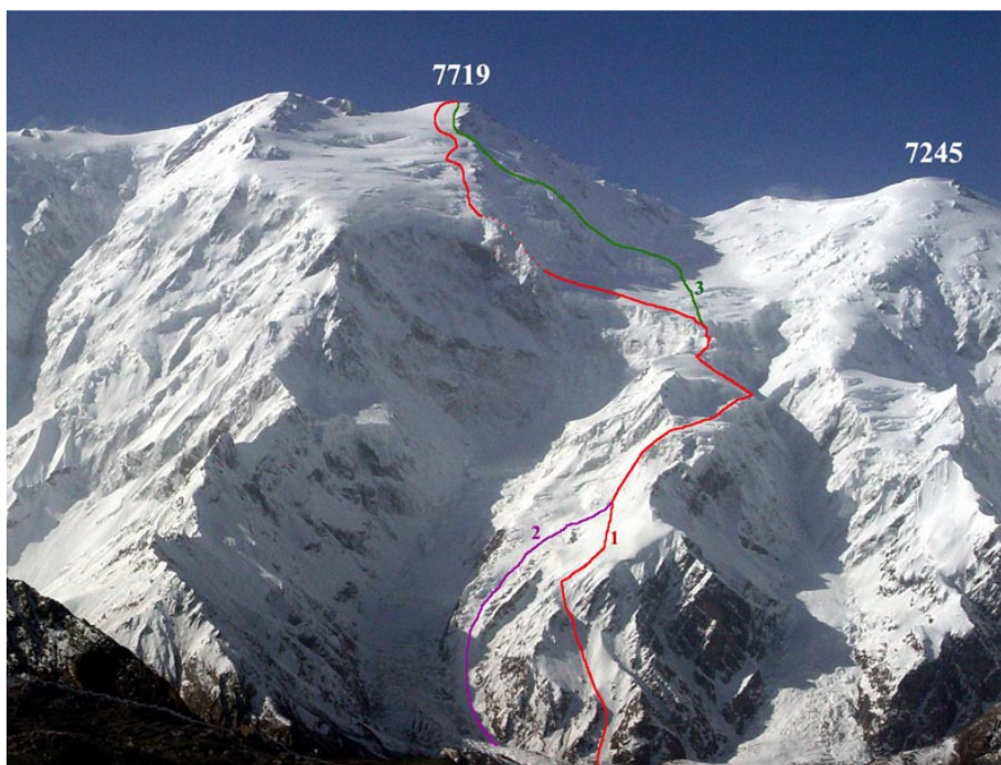
Kongur Shan od strony północnej – orientacyjny przebieg drogi rosyjskiej z wariantami z 2004 i 2007 roku Naszym celem jest wariant czerwony wyprawy rosyjskiej z 2007 roku.