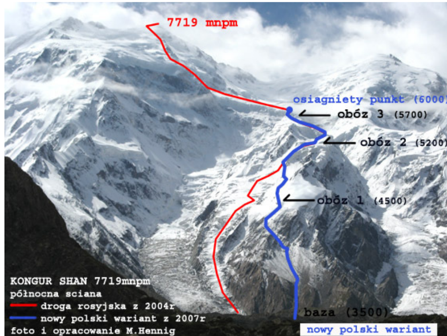
Kongur Shan od strony północnej – orientacyjny przebieg drogi rosyjskiej.

W wyprawie tej biorą udział m.in. uczestnicy wypraw na Kongur Shan z 1999 i 2007 roku. Doświadczenia i wnioski wyciągnięte z poprzednich wypraw winny zaowocować zwiększeniem szans obecnej.