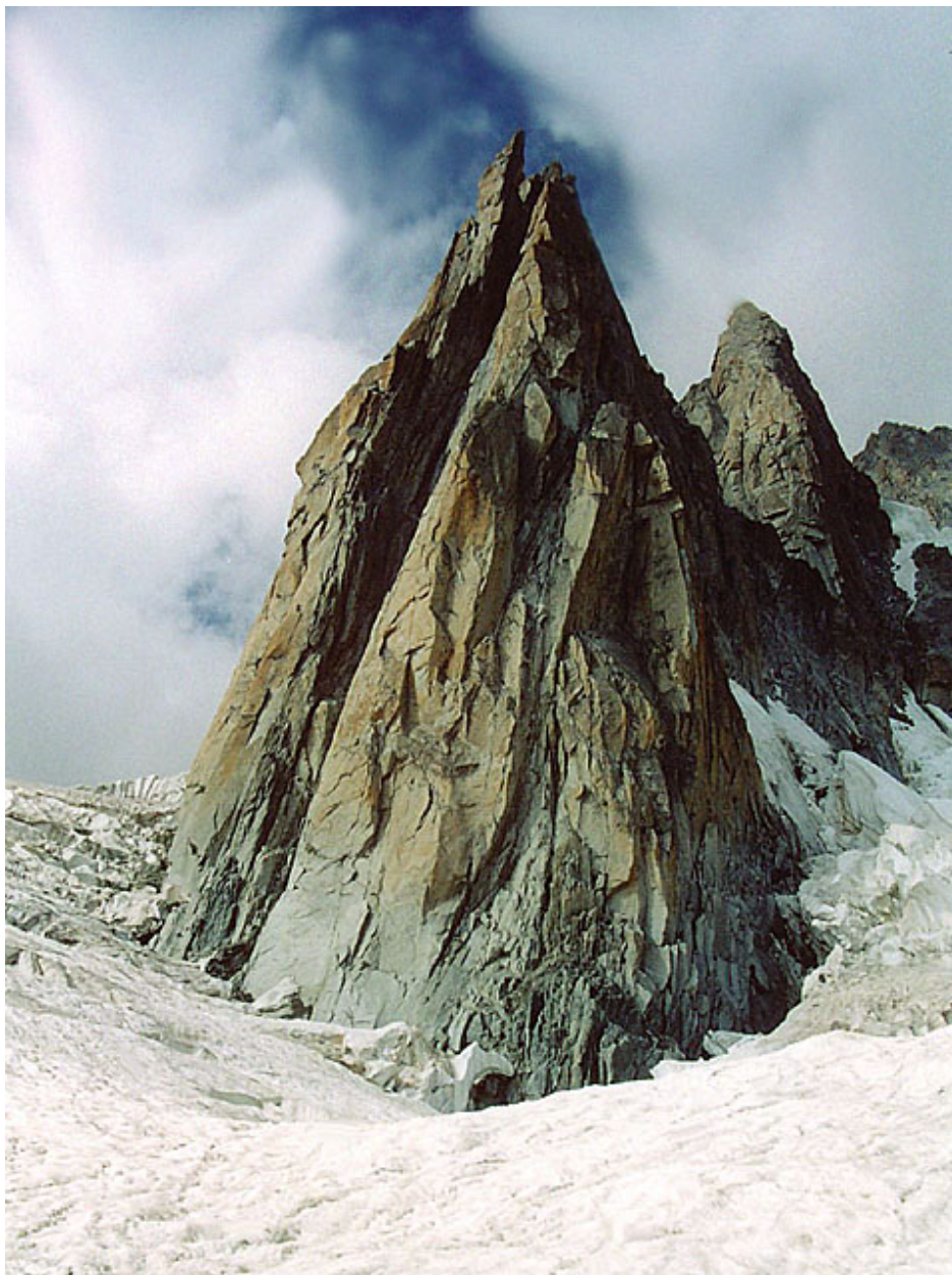
Pointe Adolphe Rey