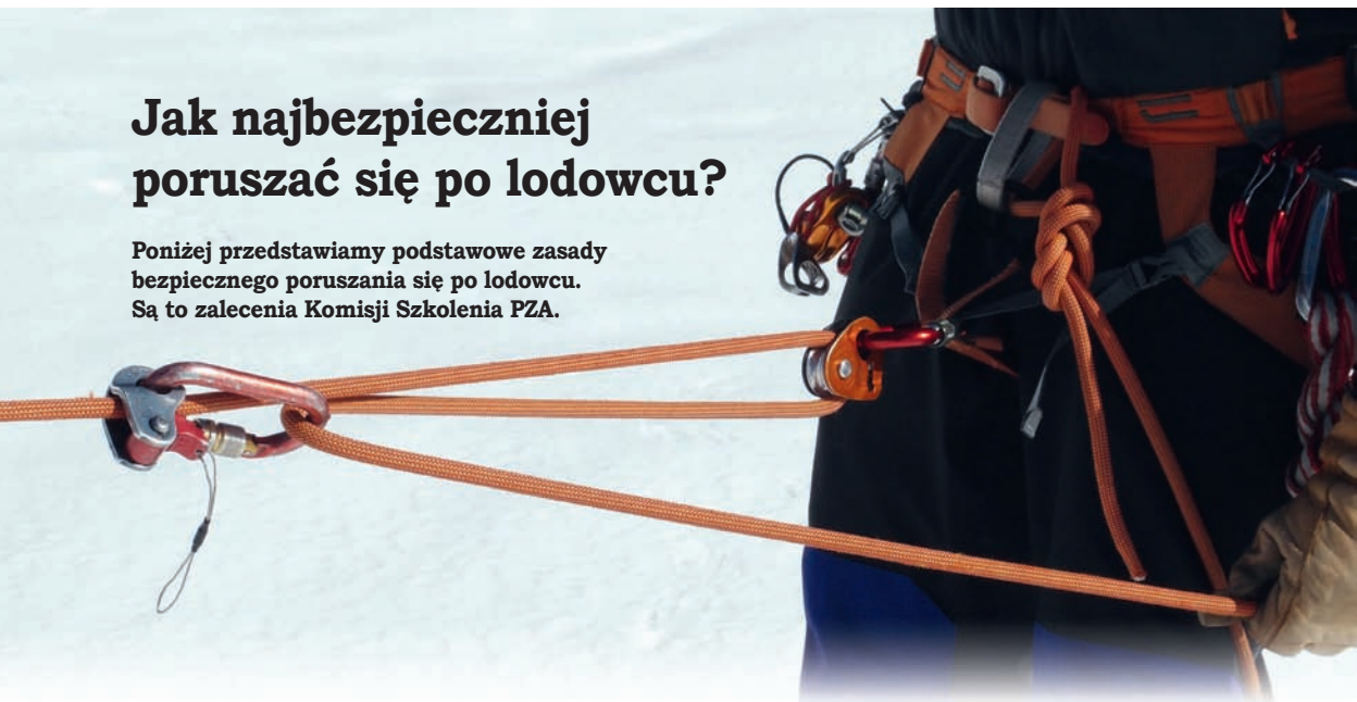
Modelowo założony układ Gardy, w użyciu RopeMAN (zamiast bloкера) oraz MikroTraction (w miejscu Gardy).

Poniżej przedstawiamy podstawowe zasady bezpiecznego poruszania się po lodowcu. Są to zalecenia Komisji Szkolenia PZA.