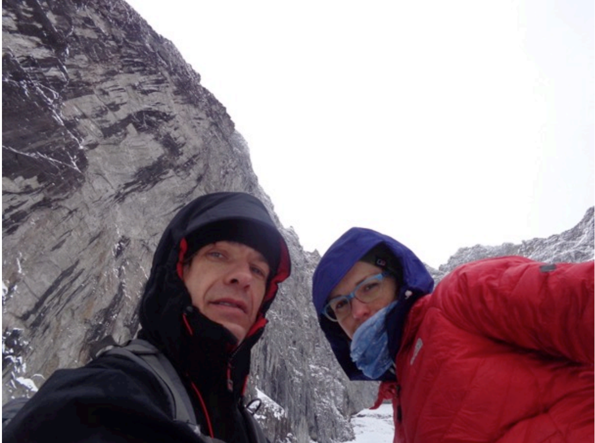
Pod ścianą Trolli

Warunki wspinaczkowe i pogodowe w dolinie Romsdalen podczas zgrupowania były trudne. Zespół trzykrotnie zanoślił depozyt pod ścianę Filara Trolli. Dwukrotnie opad śniegu uniemożliwił wspinaczkę - depozyt sprzętowy z trudem odzyskano. Za trzecim razem zespół podjął wspinaczkę jednak warunki uniemożliwiły jej kontynuowanie - na tarasach zalegał niestabilny, lawiniasty śnieg a formacje wklęsłe (kominy, zacięcia) były zawiane tzw. gipsem, przez który trzeba było przekopywać się tracąc mnóstwo czasu.