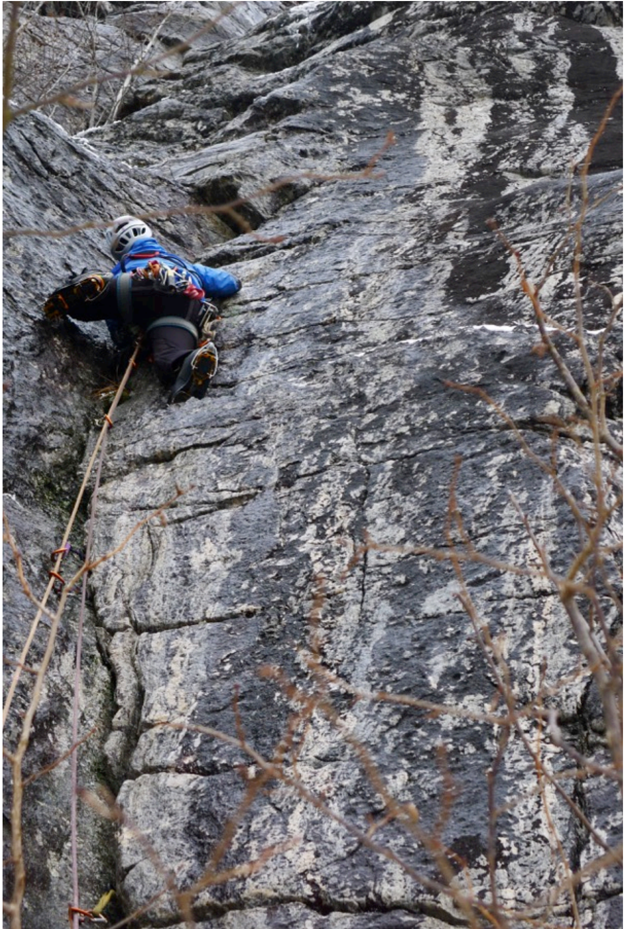
Fragment wspinaczki nową drogą w masywie Goksoyry