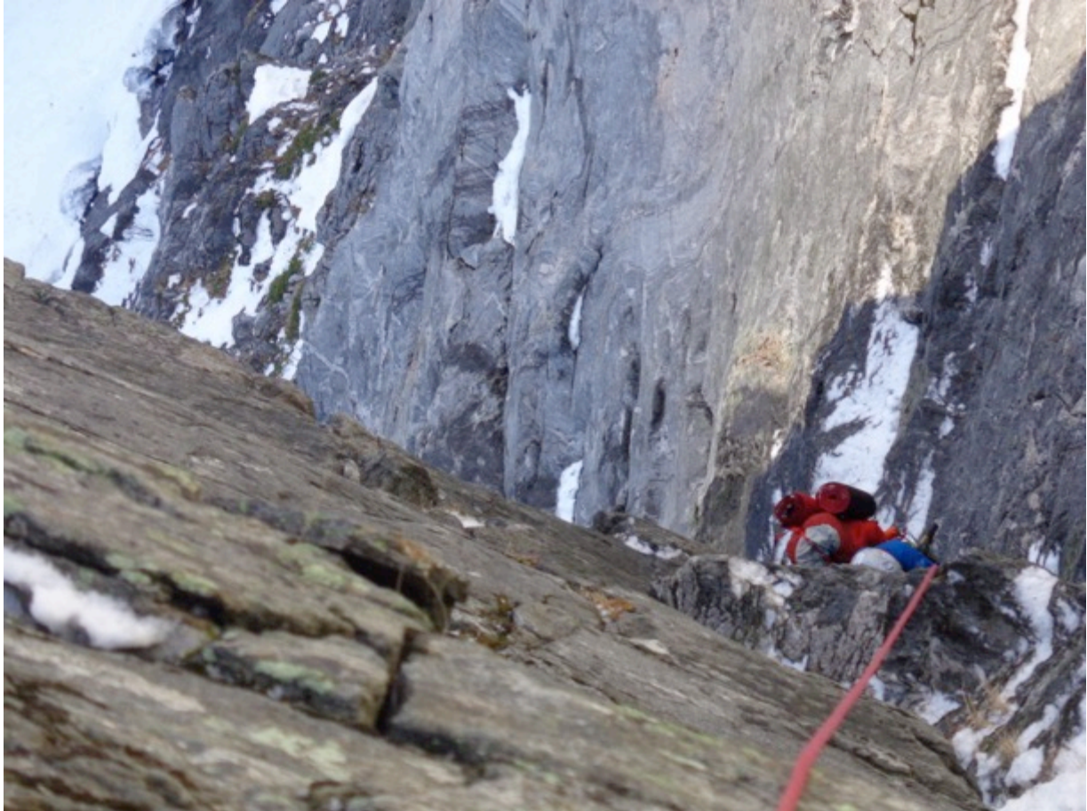
Wspinaczka na Costa Brava

W dłuższym oknie pogodowym pod koniec zgrupowania podjęto próbę pierwszego zimowego przejścia drogi Costa Brava (7, A2, 1000 m) na południowej ścianie Mongejury. W trakcie dwudniowej wspinaczki pokonaliśmy pierwszą, trudniejszą połowę drogi jednak ze względu na powolne tempo wspinaczki i zbliżające się załamanie pogody zdecydowaliśmy o wycofaniu się ze ściany.