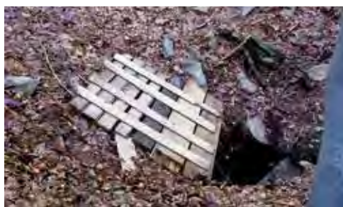
△ Historyczny Otwór Ostrej

kilkumetrowego korytarzyka jesteśmy w Mati_ASie – ogromnej, kilkunastometrowej, wysokiej szczelinie. W północnej części za progiem utworzonym z wanty szczelina robi się coraz węższa, kilkakrotnie zakręca, by zakończyć się zawaliskiem.