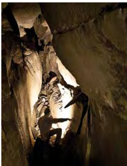
△ Okolice Ostatniej Sali