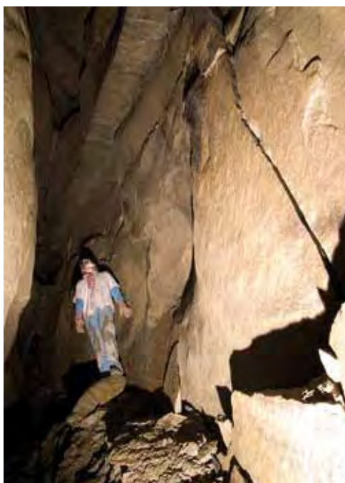
△ OST-150 • fot. M. 'JEZIO' Jeziorski

Południowa część Mati_ASa o dnie zasłanym wielkimi blokami skalnymi kończy się niedostępnymi szczelinami na kilku wysokościach z wyczuwalnym przewiewem. Na całej długości sali znajduje się kilka niewielkich, ciasnych i trudnodostępnych szczelin.