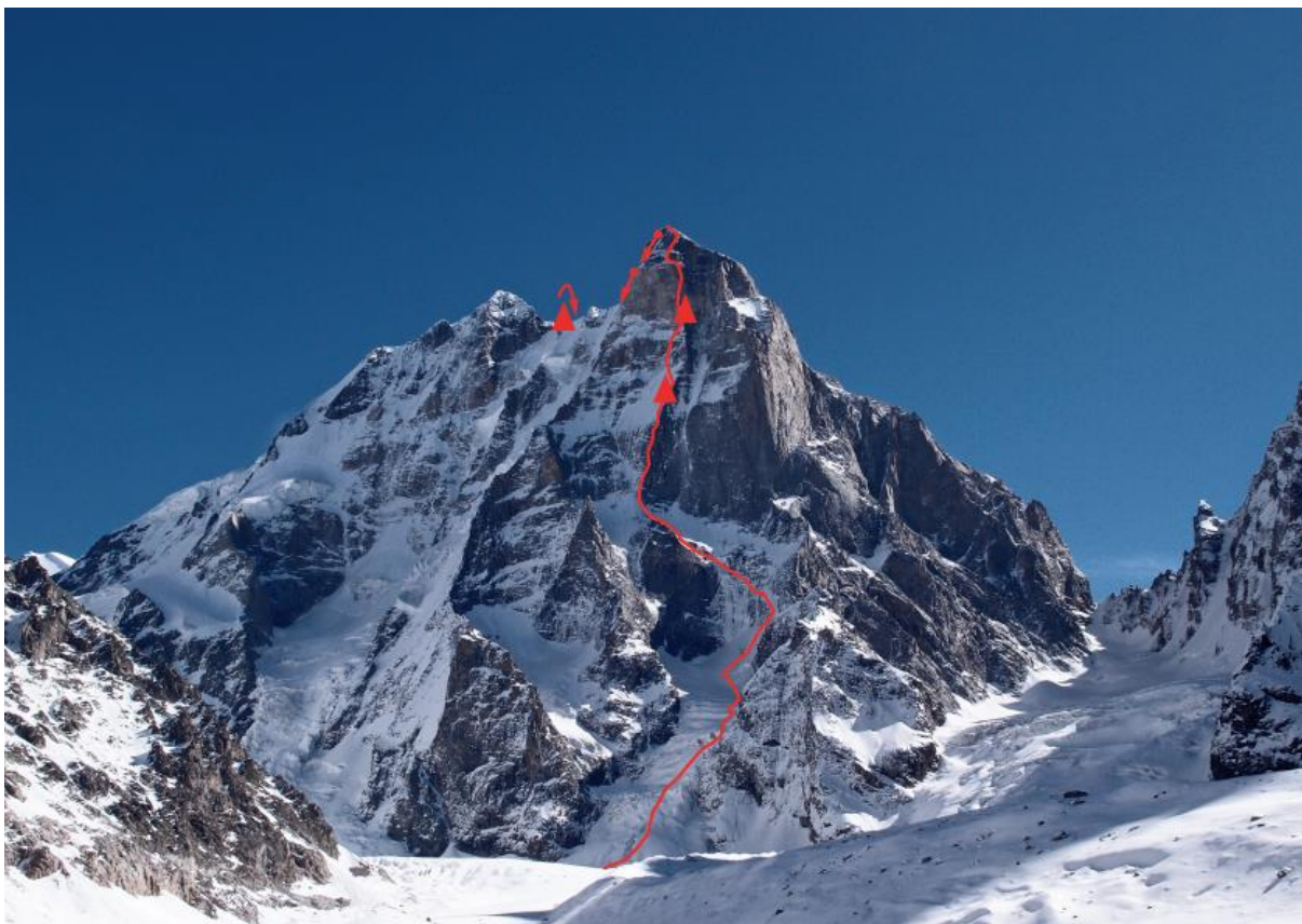
Zdj. 2. Uszba Południowa widziana z lodowca Uszbijskiego (widok z zachodu). Linia czerwona – przebieg drogi z zaznaczonymi miejscami biwakowymi. Zdjęcie archiwalne, nie przedstawia warunków podczas przejścia.