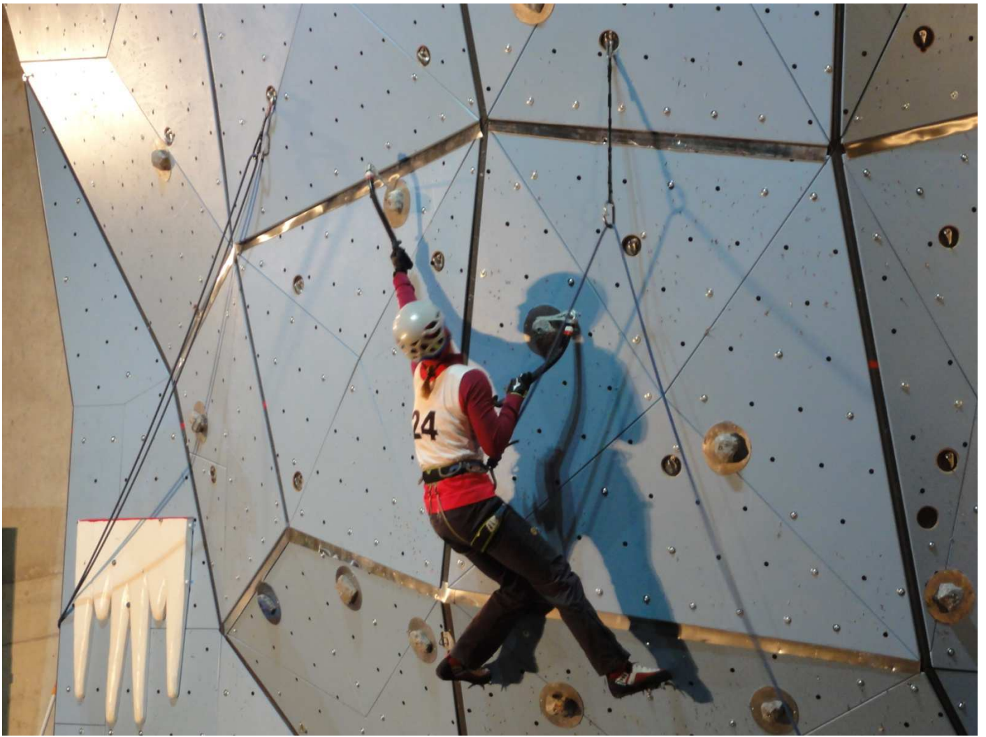
Ola na drodze finałowej, fot. Kuźnia Szpeju.