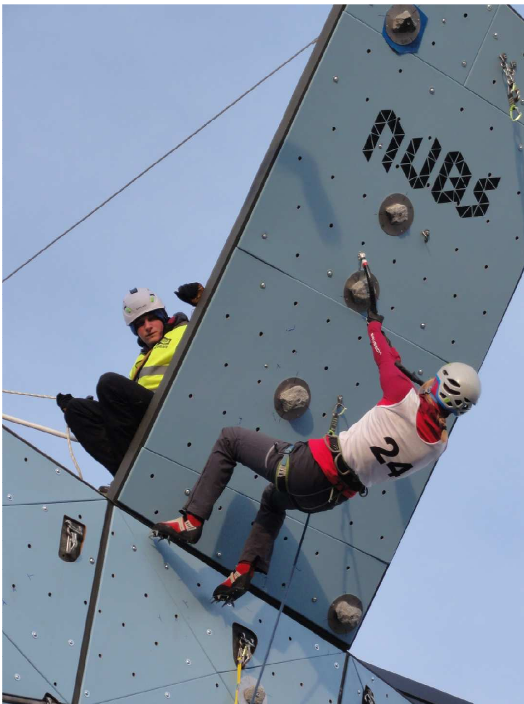
Ola na drodze eliminacyjnej nr 2, fot. Kuźnia Szepeju.