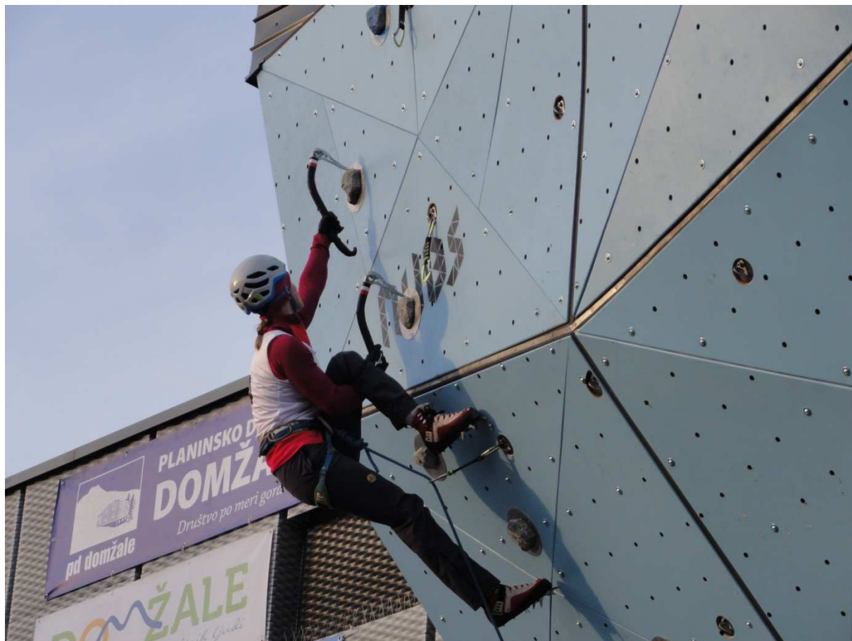
Ola na drodže eliminacyjneje nr 1, fot. Kužnia Szepeju.