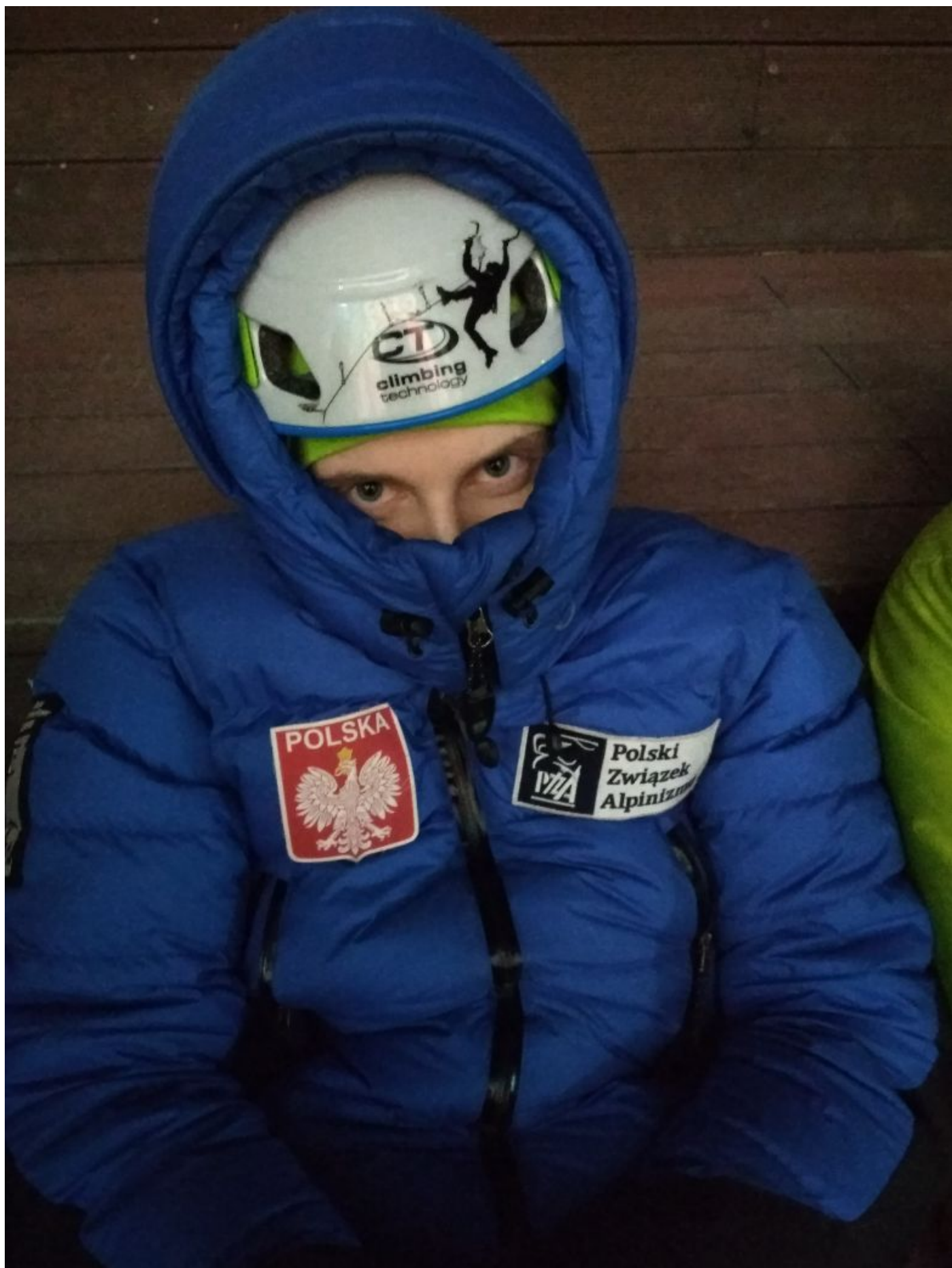
W oczekiwaniu na czasówki, które nie chciały się zacząć...