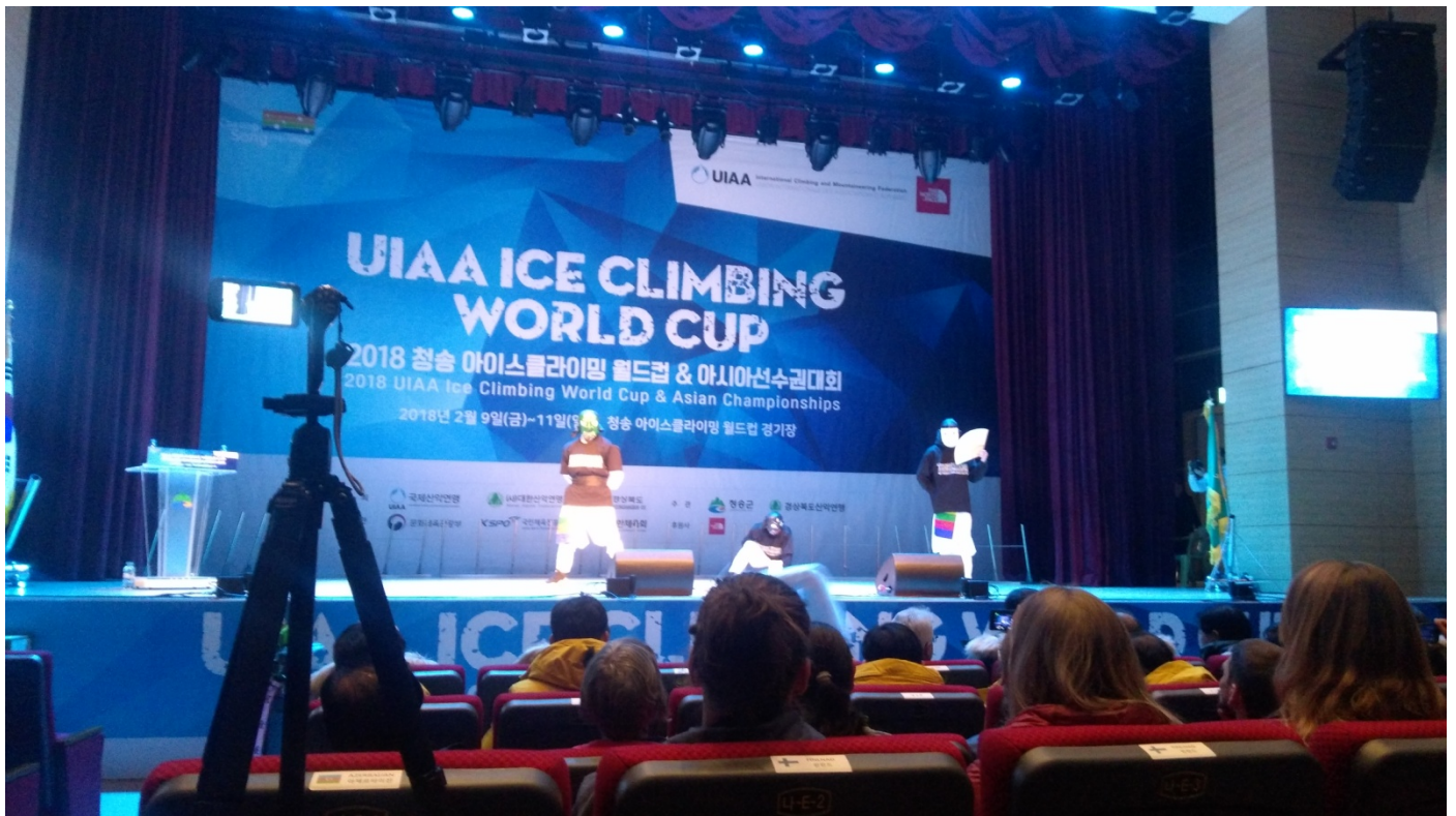
Ceremonia otwarcia zawodów