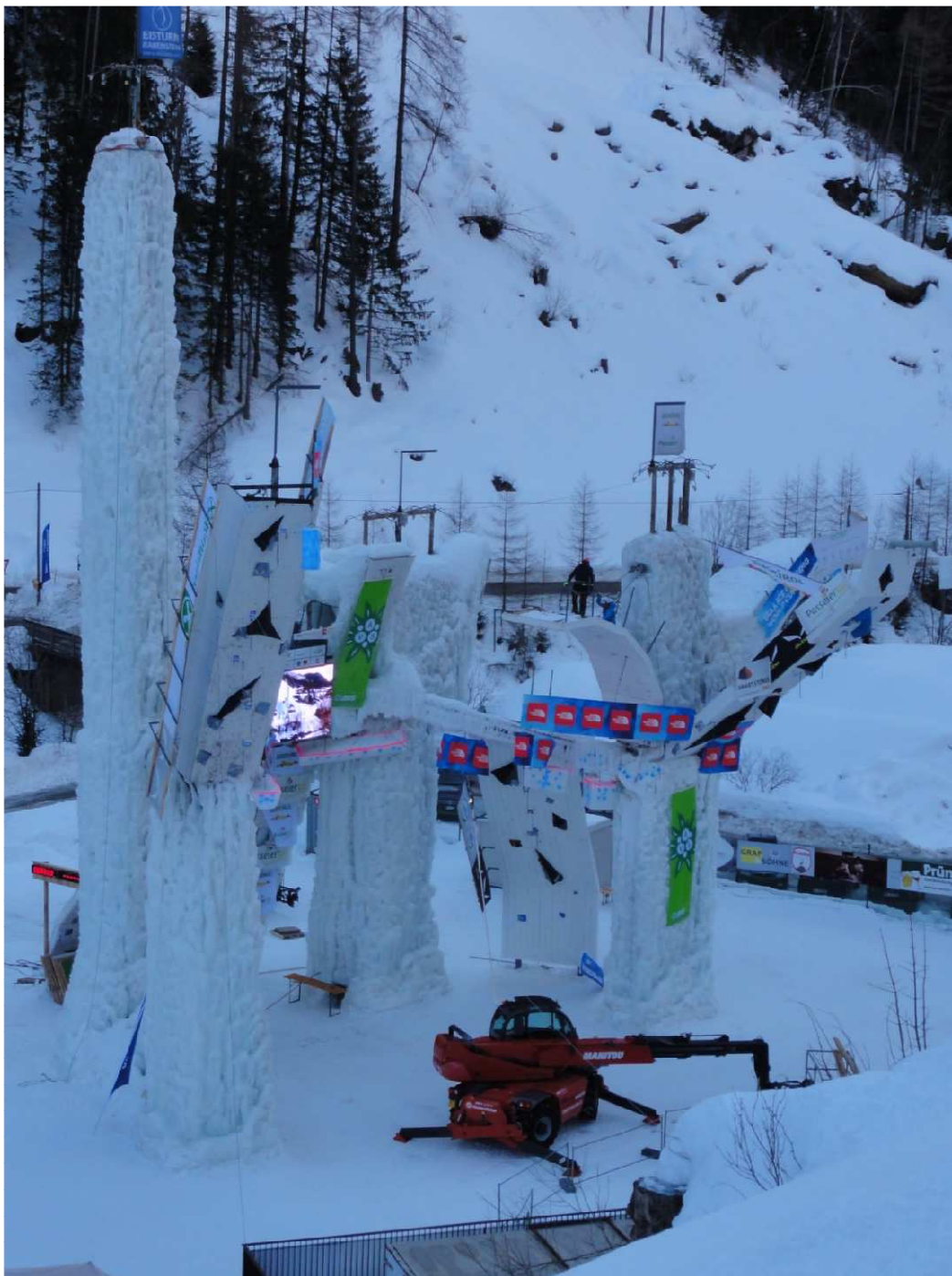
Ściana wspinaczkowa w Rabenstein, fot. Kuźnia Szpeju.