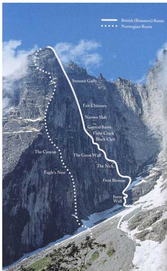
Przybliżony przebieg drogi norweskiej w ścianie Trolli