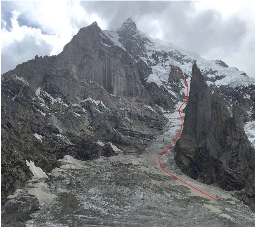
2 Próba Ballard Nardi z 2017 roku od strony Wschodniej