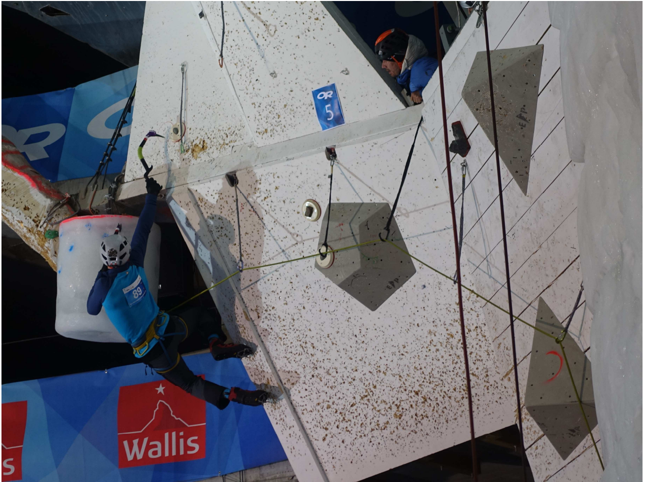
Alek na drodze eliminacyjnej