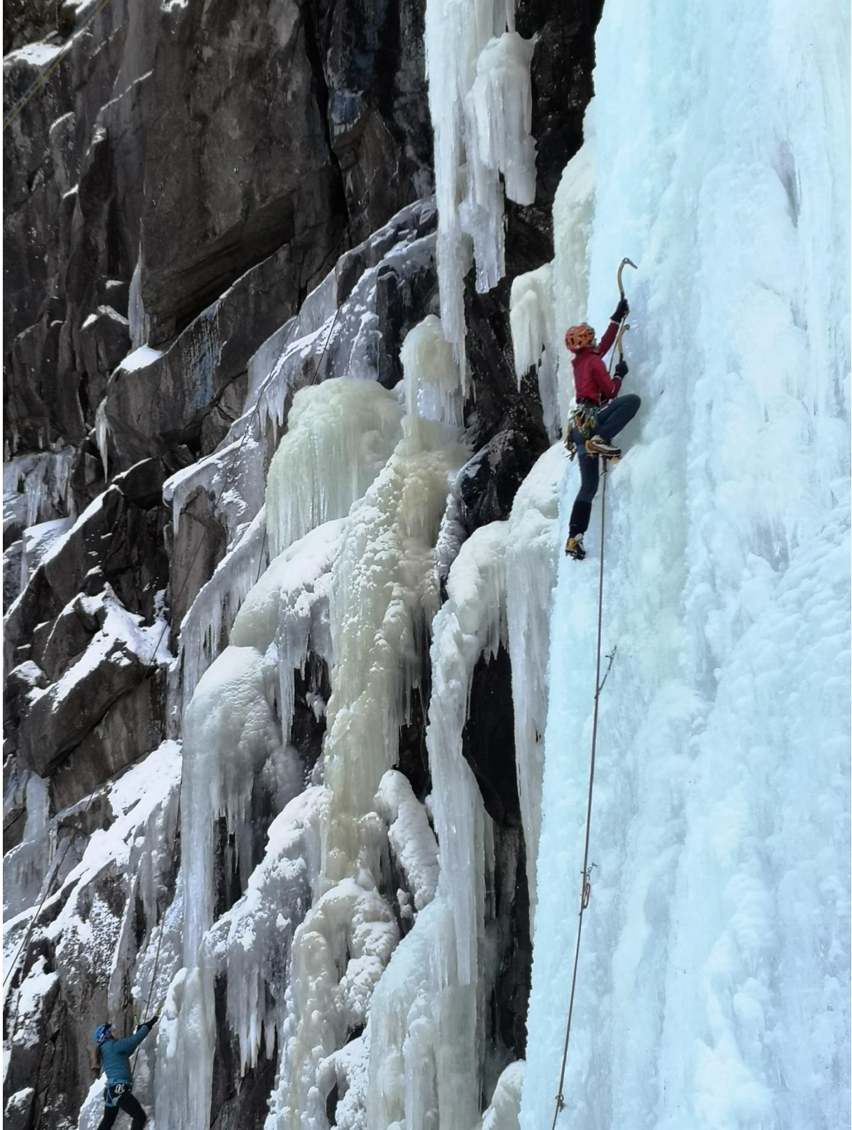
Szkolenie w Golsjuvet