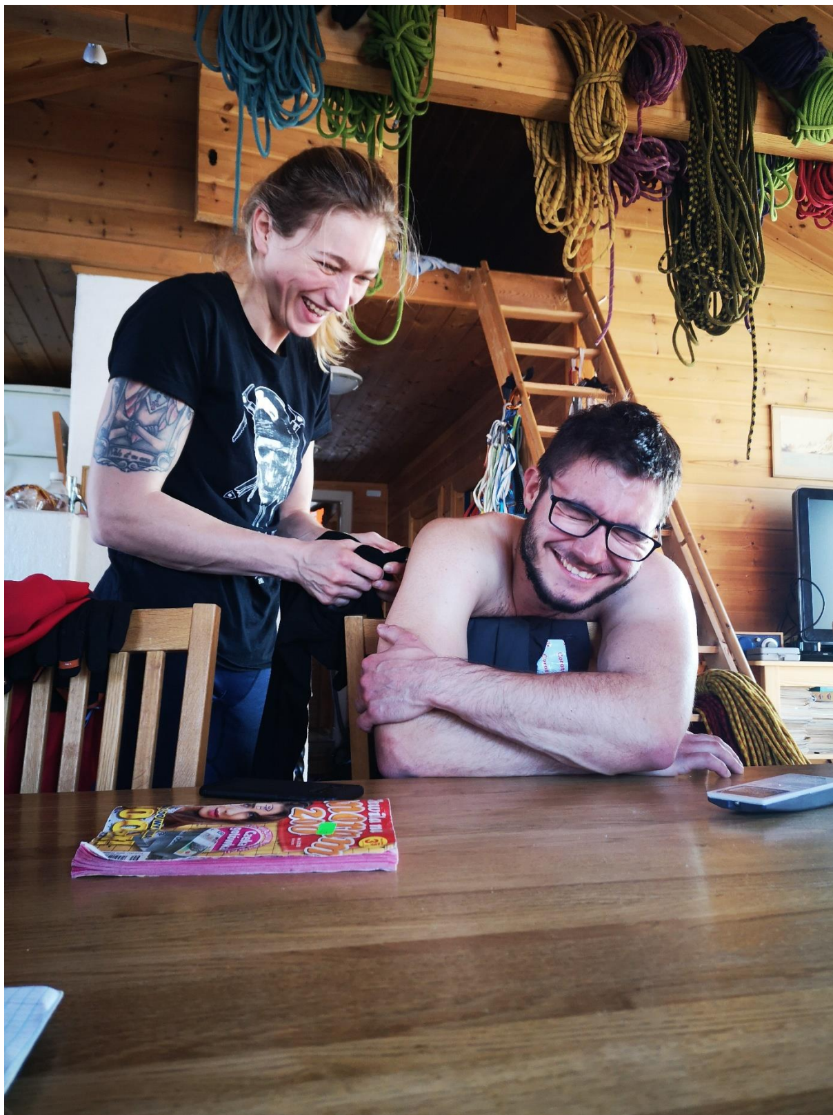
Rozluźnianie spiętych mięśni