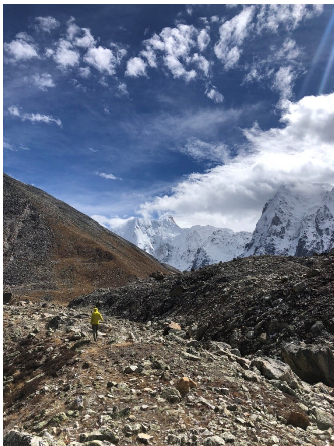
Rekonesans 05.10.22 (przed opadem).