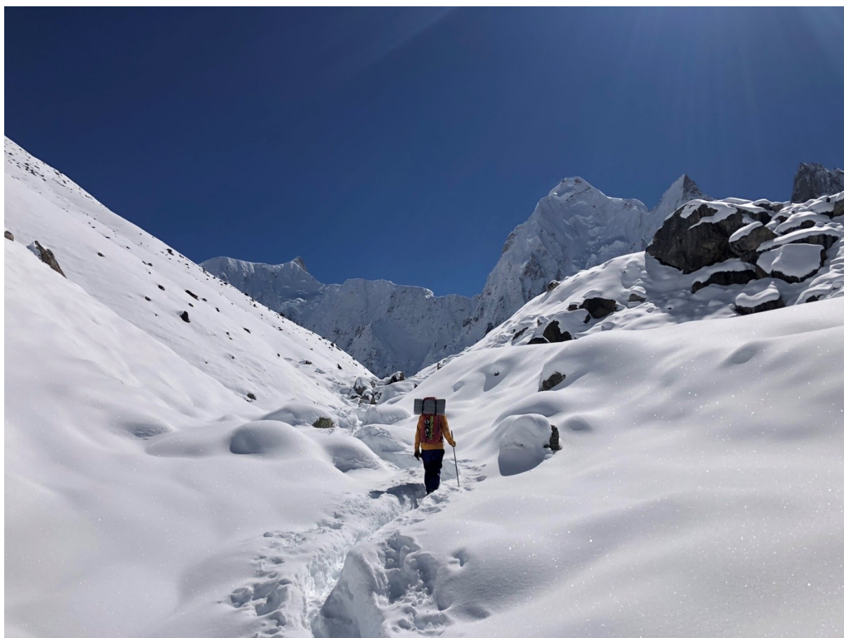
W drodze do ABC 14.10.2022 (po opadzie).