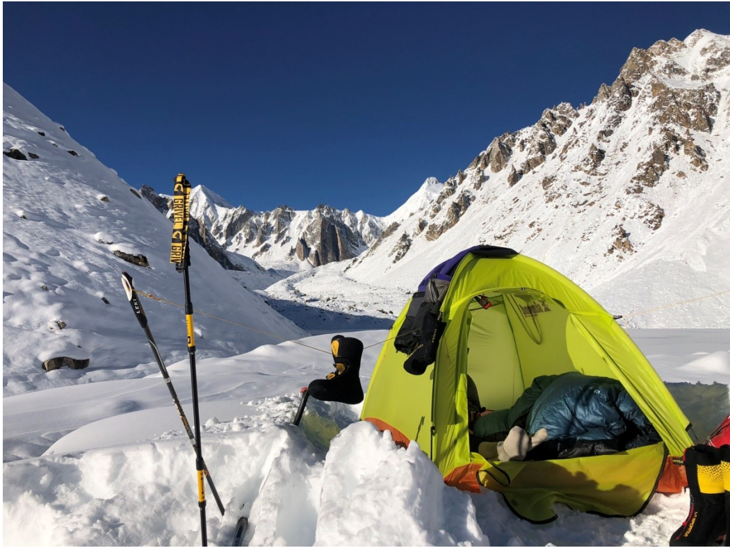
ABC na wysokości 5000 m n.p.m.