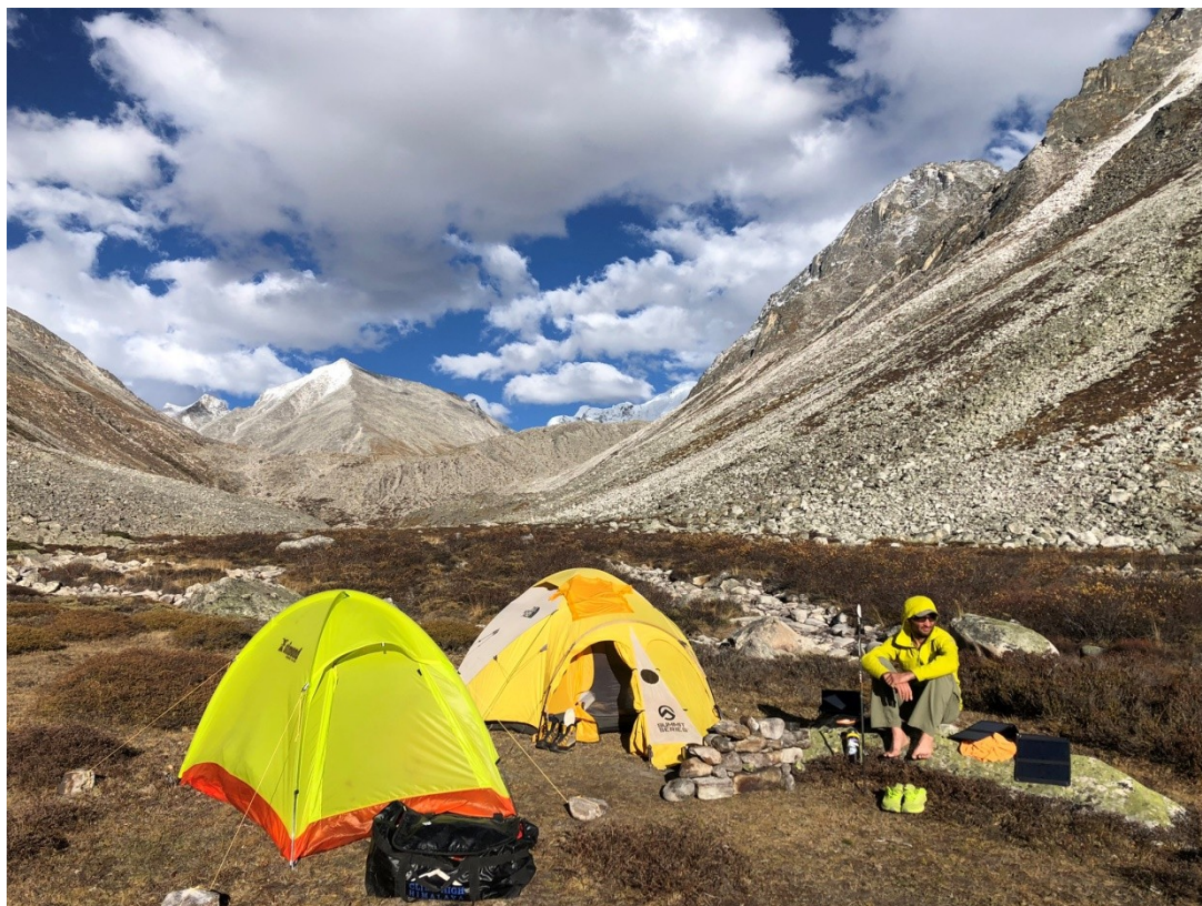
Baza wysokość 4390 m n.p.m.