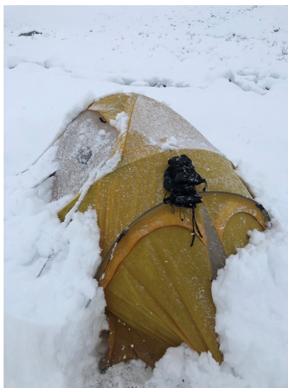
Zasypany namiot po nocnych opadach śniegu.