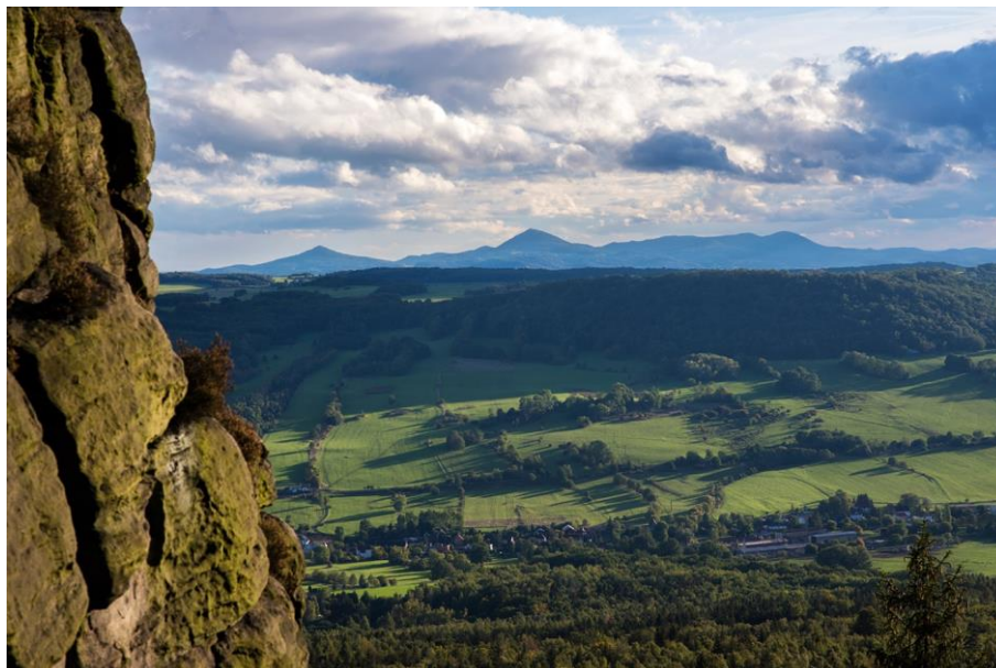
Krajobraz Sněžnika widziany spod pobliskiego Modrina

W roku 2022 przewidziane zostały po raz pierwszy aż 3 Zgrupowania Kadry dla najmłodszych. Dwa razy postawiliśmy na dobrze znane rejony: Frankenjurę (w czerwcu) oraz Osp (planowany w listopadzie), natomiast tym razem po raz pierwszy zamiast lin i ekspresów zapakowaliśmy 12 crashpadów (sam nie wiem jak udało się je zmieścić) i ruszyliśmy w stronę czeskich piaskowców.