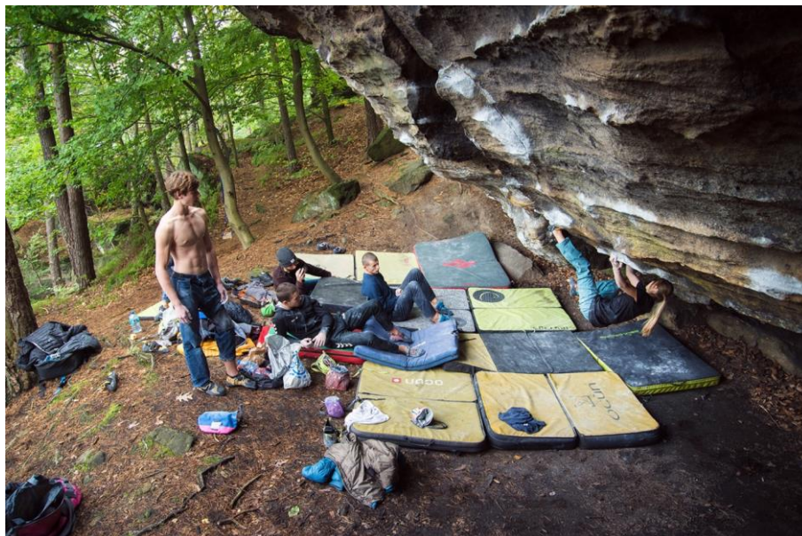
Czarny Biwak w Labaku, skałka z dużym potencjałem. Maja na Black and Decker 7C+

Znalezienie celu na trzeci i czwarty dzień nie należał do łatwych. Nasz wybór padł ostatecznie na jeden wyjątkowy kamień położonym nad łabą. Mnogość kombinacji, unikalne chwyt i przyjazna dla skóry skała ostatecznie umożliwiły realizację ambitnych przejść prawie wszystkim z nas, a niektórym wyrównanie życiowych wyników. Czarny biwak okazał się strzałem w dziesiątkę!