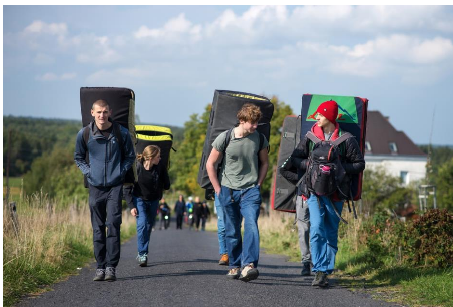
Podejście pod Sněžník z dużą ilością „bagaży”

W roku 2022 przewidziane zostały po raz pierwszy aż 3 Zgrupowania Kadry dla najmłodszych. Dwa razy postawiliśmy na dobrze znane rejony: Frankenjurę (w czerwcu) oraz Osp (planowany w listopadzie), natomiast tym razem po raz pierwszy zamiast lin i ekspresów zapakowaliśmy 12 crashpadów (sam nie wiem jak udało się je zmieścić) i ruszyliśmy w stronę czeskich piaskowców.