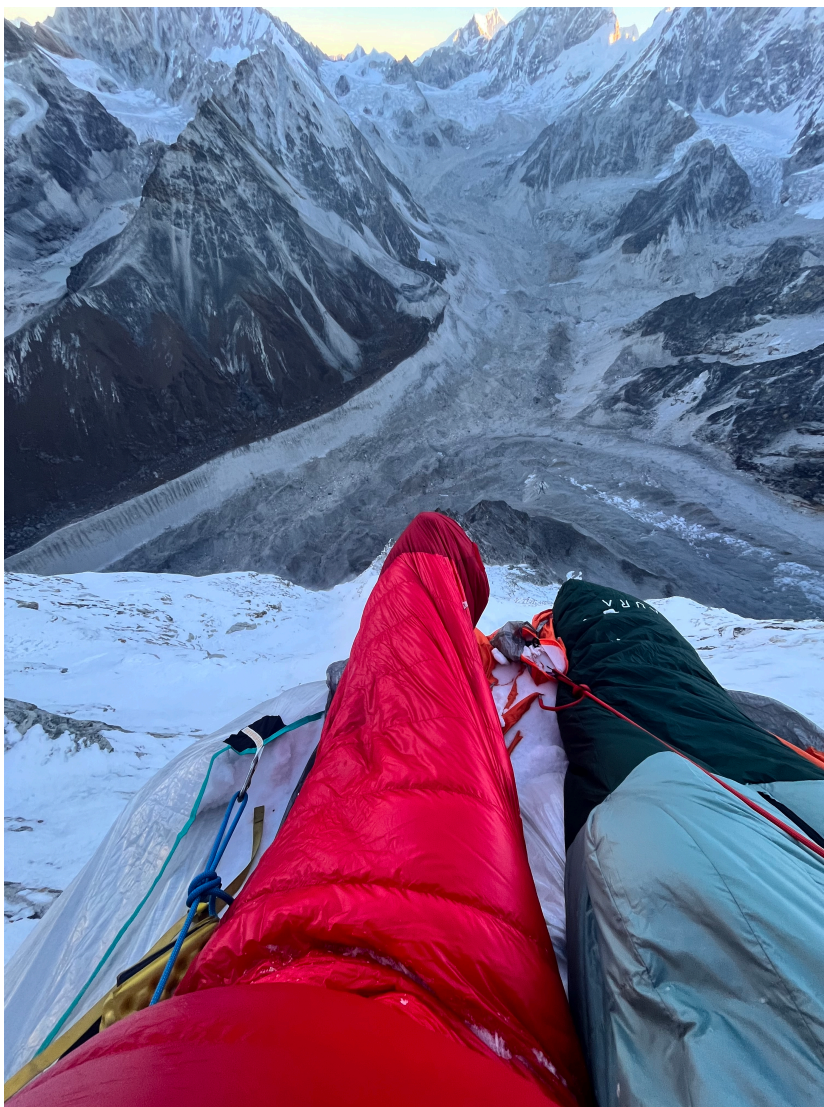
Siedzący biwak na wysokości 5800 m.n.p.m

15 października wspinaczka w centralnej części headwall biwak na śnieżnym ramieniu na wysokości 6200 m.n.p.m