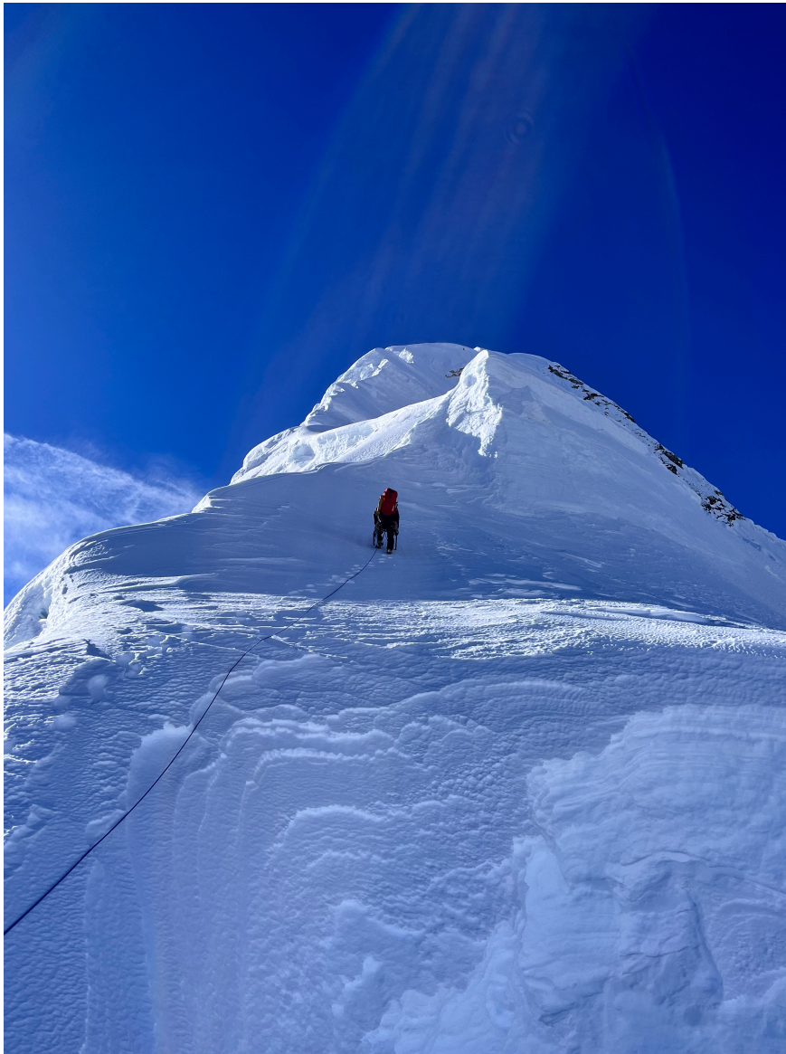
Śnieżna grań prowadząca na szczyt

19-21 października odpoczynek w wiosce Na