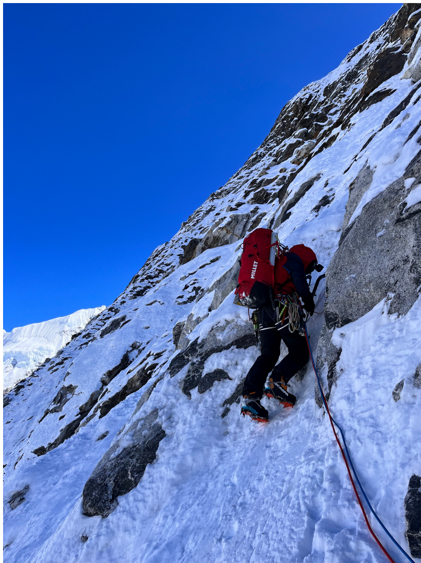
Wspinanie w centralnej części headwall

6 października wyjście aklimatyzacyjne nocleg na 5400 m.n.p.m