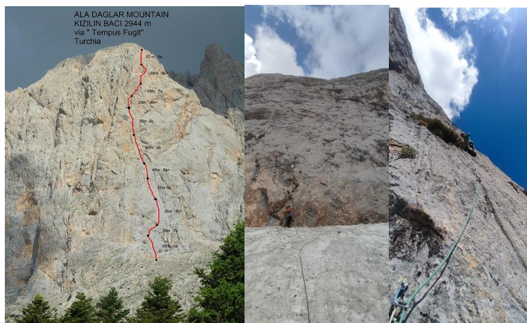
Kizilin Baci, Tempus fugit:7b+