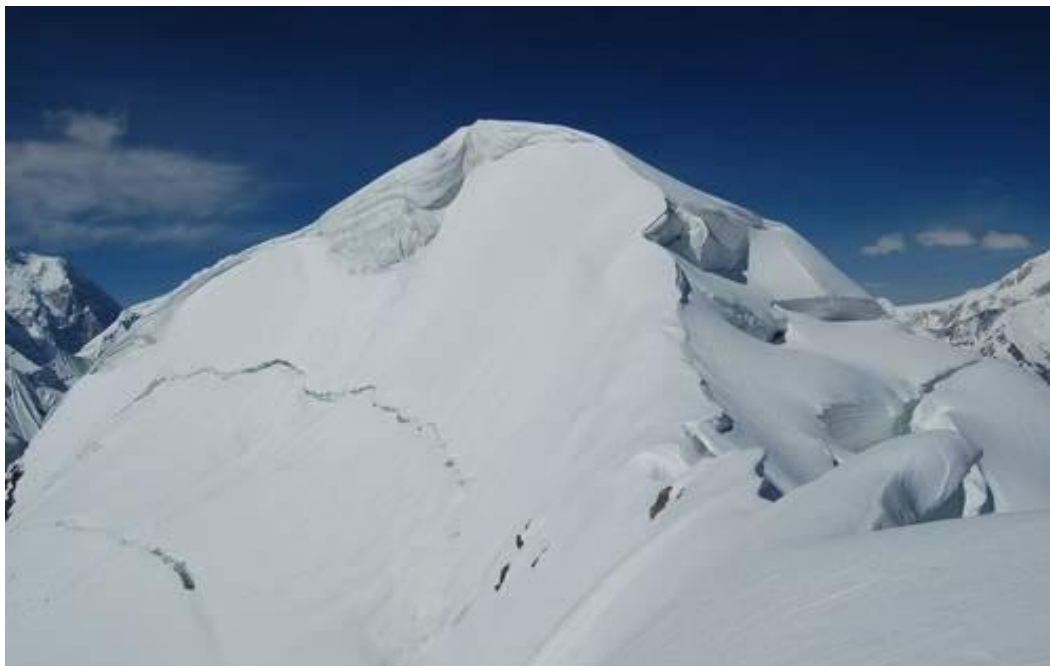
Wierchólek Yazgil Sar (5964)

Po wejściu na szczyt aklimatyzacyjny przeniesiemy się pod Shimshal White Horn – główny cel wyprawy.