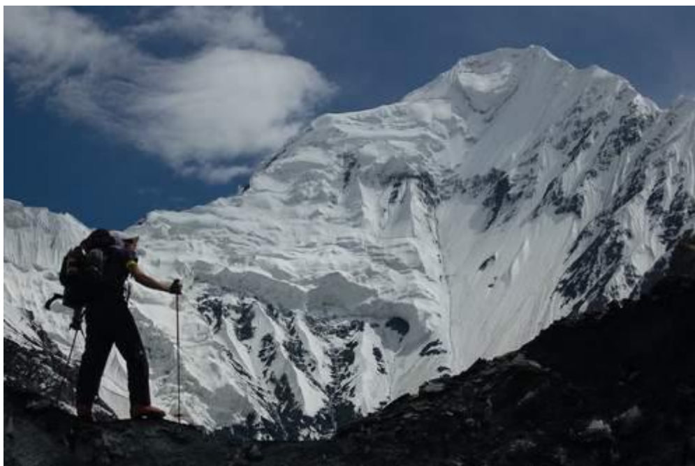
Widok na White Horn (6303)