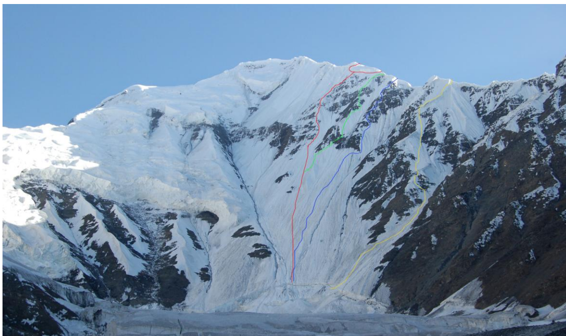
Potencjalne drogi na dziewiczej północnej ścianie

Wariantem rezerwowym jest możliwość powtórzenia drogi francuskiej „kuluarem tysiąca rynien” (D, 50 st.,800 m), a następnie wejście granią północną na szczyt.