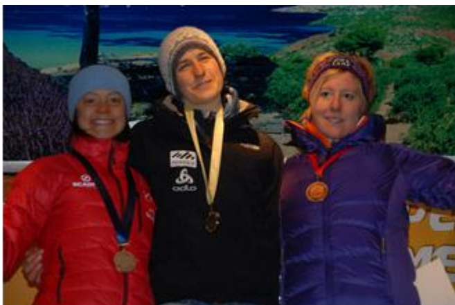
„Mistrzini i wicemistrzynie Europy”