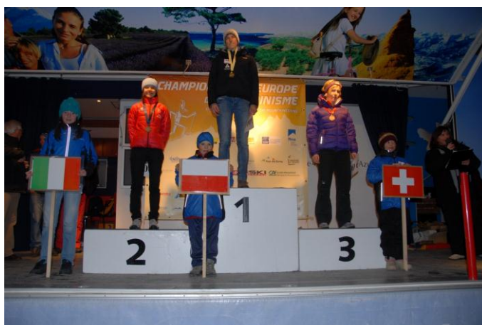
„Mistrzostwa Europy – złoto dla Polki”