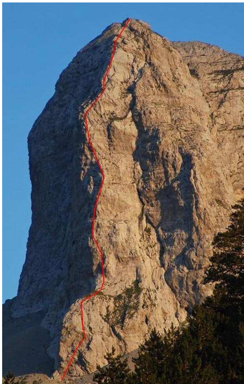
Orientacyjny przebieg nowej drogi na filarze niezdobytej Maji Stogut

Planujemy wyprawę w góry Prokletje w terminie 01.08-22.08 tego roku. Naszymi celami są nowe drogi na rozpoznanych już ścianach Maja Vukoces oraz turni „Bridashe”, na której znajduje się droga „Kolegi dzium”. Planujemy również nadrobić zaległości z poprzedniej wyprawy, czyli poprowadzić nową drogę na filarze turni Maja Stogut , która nie ma udokumentowanego wejścia na szczyt. Potencjał eksploracyjny tej części Gór Prokletje jest tak wielki, że jeśli tylko starczy nam czasu z pewnością będziemy chcieli poprowadzić jak największą ilość dróg.