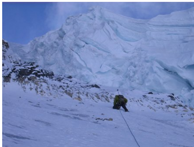
Mt. Edith - South East Chimneys (II, 5,4), Lokalizacja: Banff, Alberta