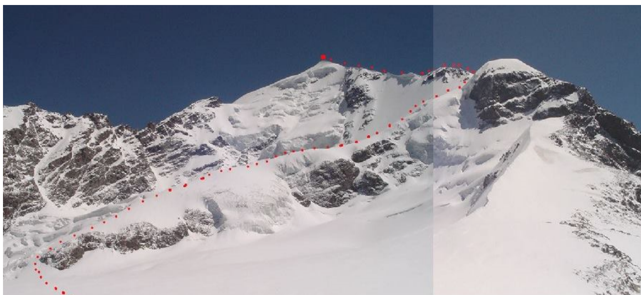
Droga na szczyt od lodowca Kasebi, widziana z obozu II