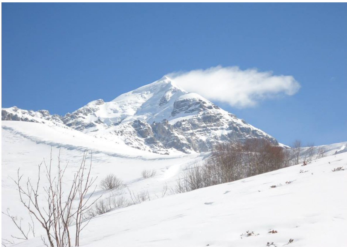
Fot. Dominika Lewińska-zrobione podczas zeszłorocznego wyjazdu „South-West Ridge” widoczna po prawej.

Zwracamy się z prośbą o przyznanie dofinansowania do wyprawy członków KW Bielsko-Biała na Kaukaz. Wyjazd planowany jest na luty 2014r. Celem wyjazdu jest zimowe wejście na Tetnuldi (4858m) drogą „South-West Ridge”