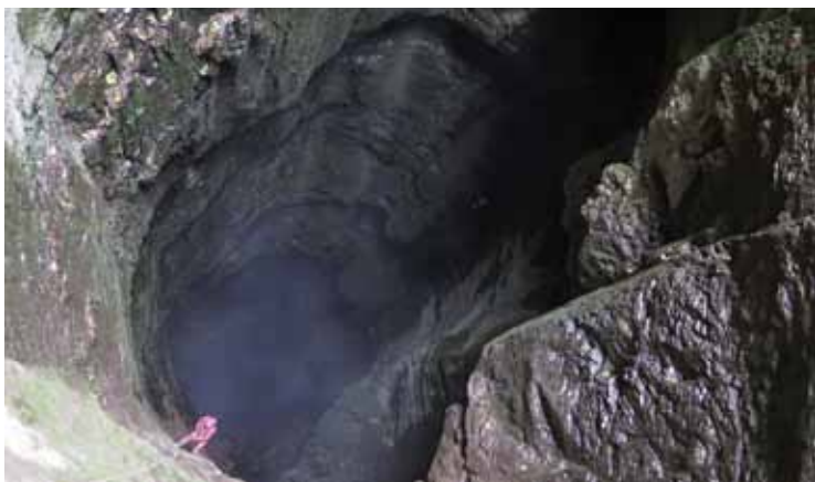
Studenca wlotowa P150 w jaskini Da Chu Ping Dong, Lichuan

25 października 2014 w Podlesicach odbyło się rozszerzone spotkanie KTJ z kierownikami wypraw, instruktorami i przedstawicielami Zarządów klubów. Omówiono planowany budżet KTJ na rok 2015 (planowane dofinansowanie wypraw), kwestie ubezpieczeń i wypadków jaskiniowych, podjęto działania zmierzające do powołania Grupy Ratownictwa Jaskiniowego KTJ PZA.