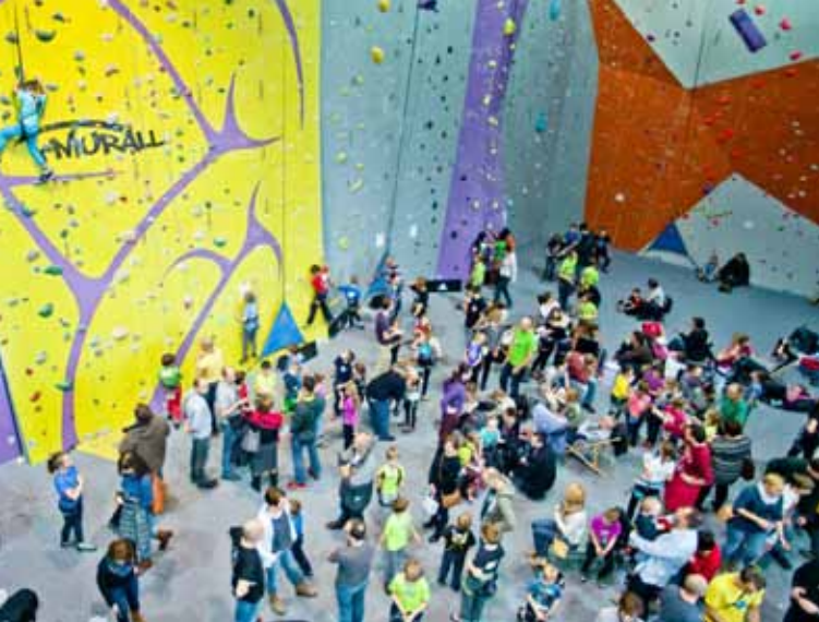
Finał zawodów PMiD zgromadził sporą grupę młodych wspinaczy