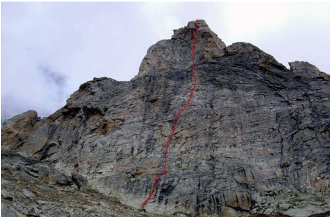
David's 62 Nose (ca. 4950m)