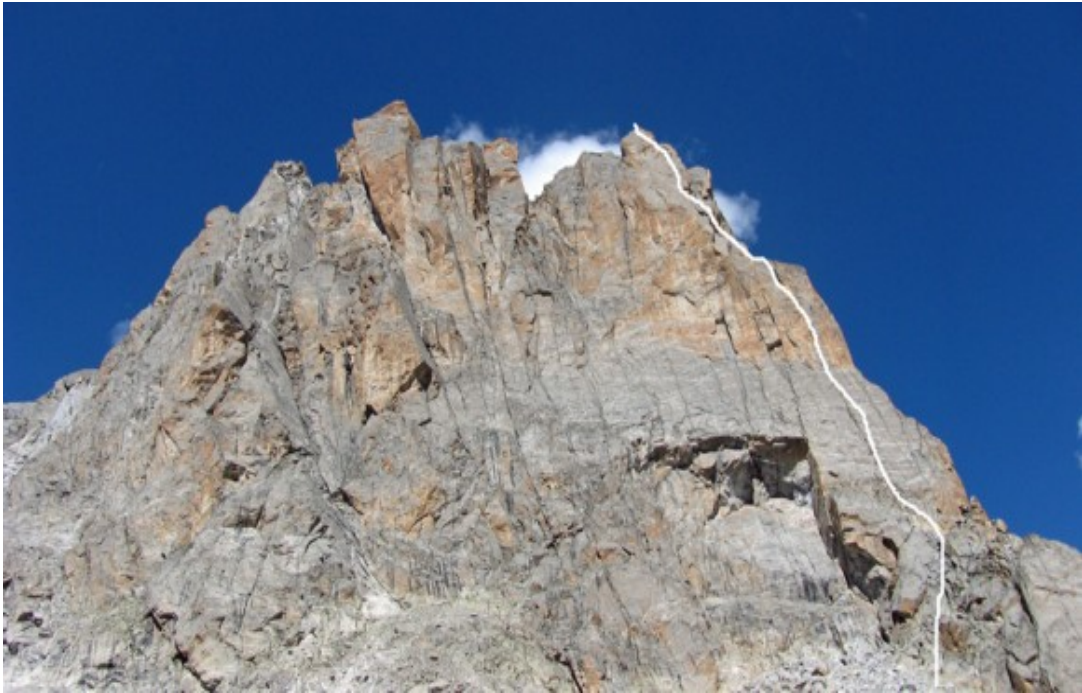
Orange Tower i zaznaczona droga Shepard Pie