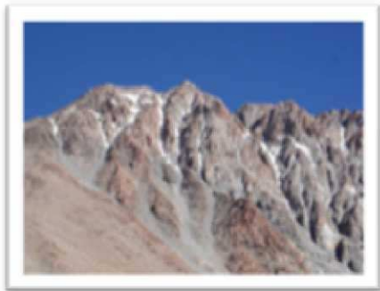
Nevado de Chani

Treking do szczytu wiedzie przez tropikalny las wzdłuż doliny rzeki. Szczyt zaczyna być widoczny po wejściu na przełęcz na wys. 4000 m n.p.m.