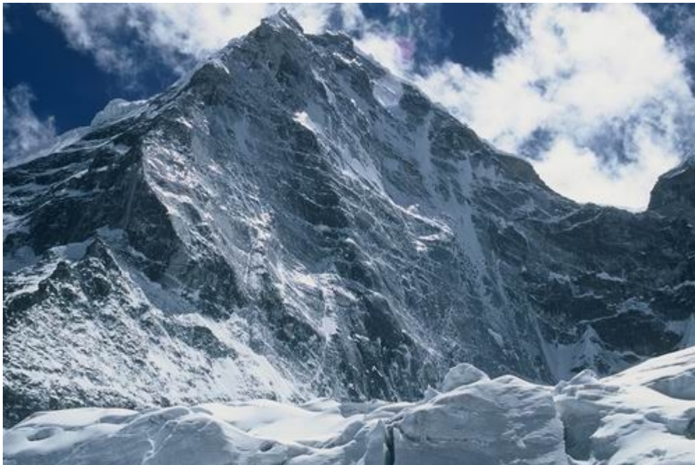
Północna ściana Kangtega 6782 m.

Dzień 33-36: Katmandu oraz powrót do kraju.