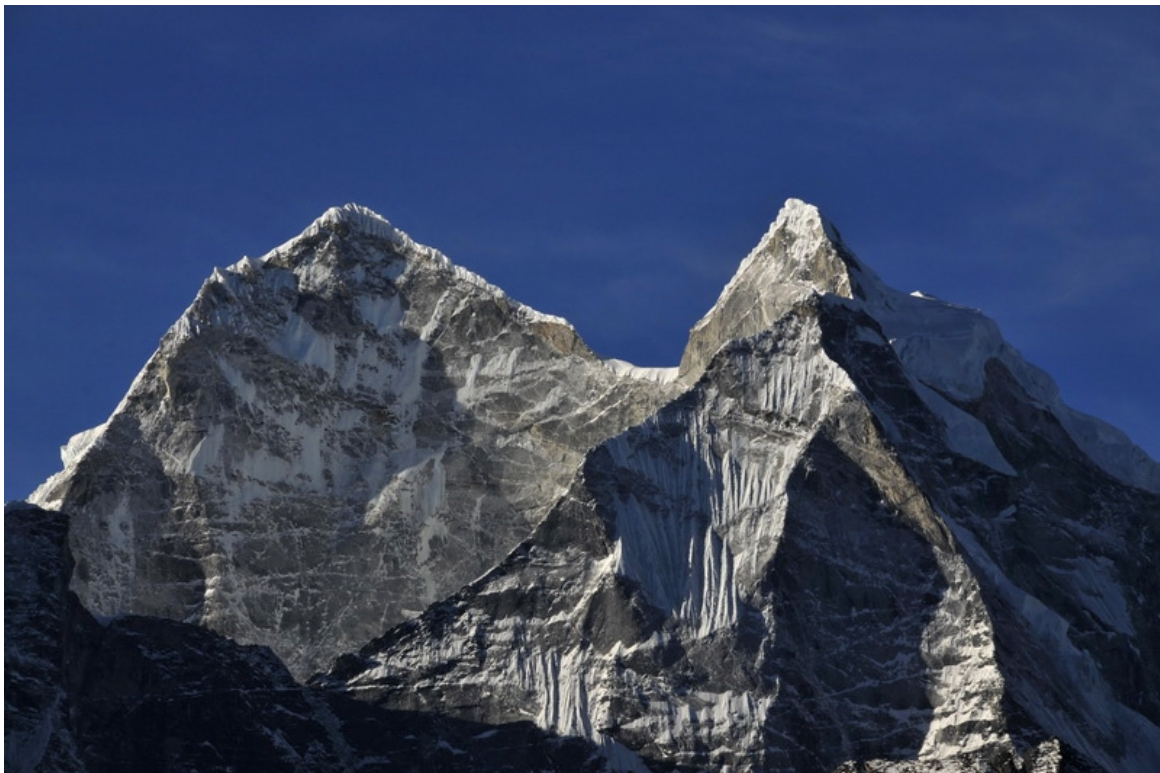
Kangtega 6782 m n.p.m.