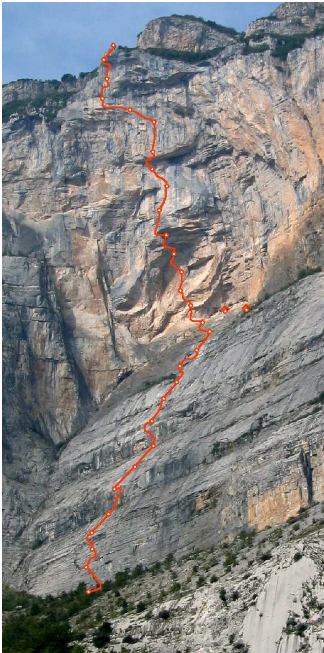
Rysunek 1 Przebieg drogi Via Vertigine