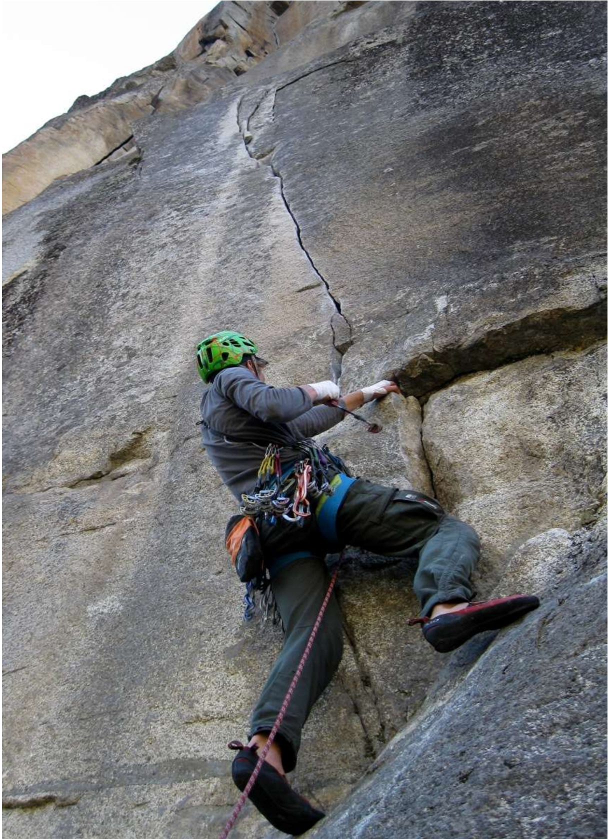
Zdjęcie 5. Wyciąg 11c na drodze The North Face na Rostrum.