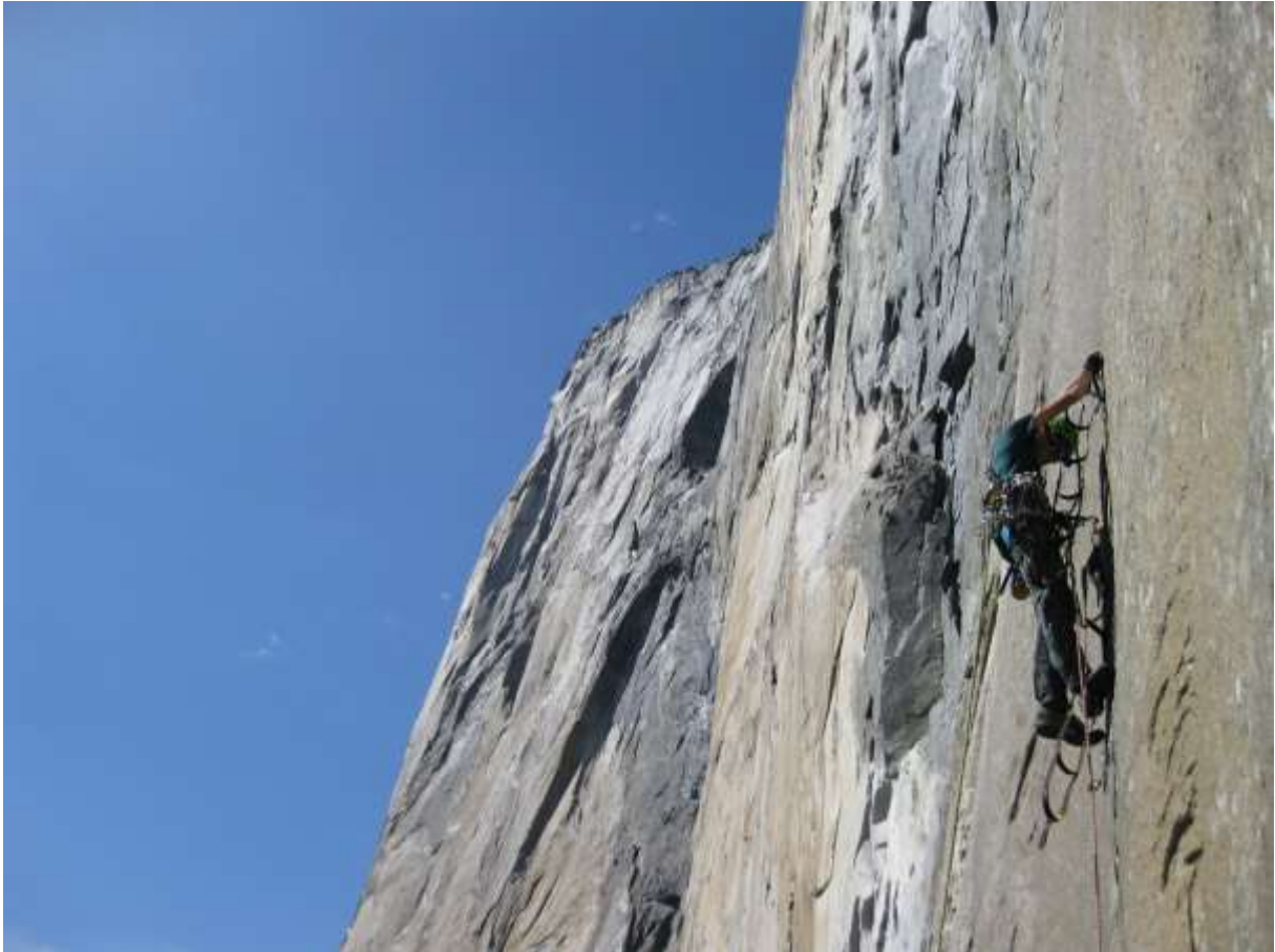
Zdjęcie 3. Sekcja po rivetach na drodze Zodiac.