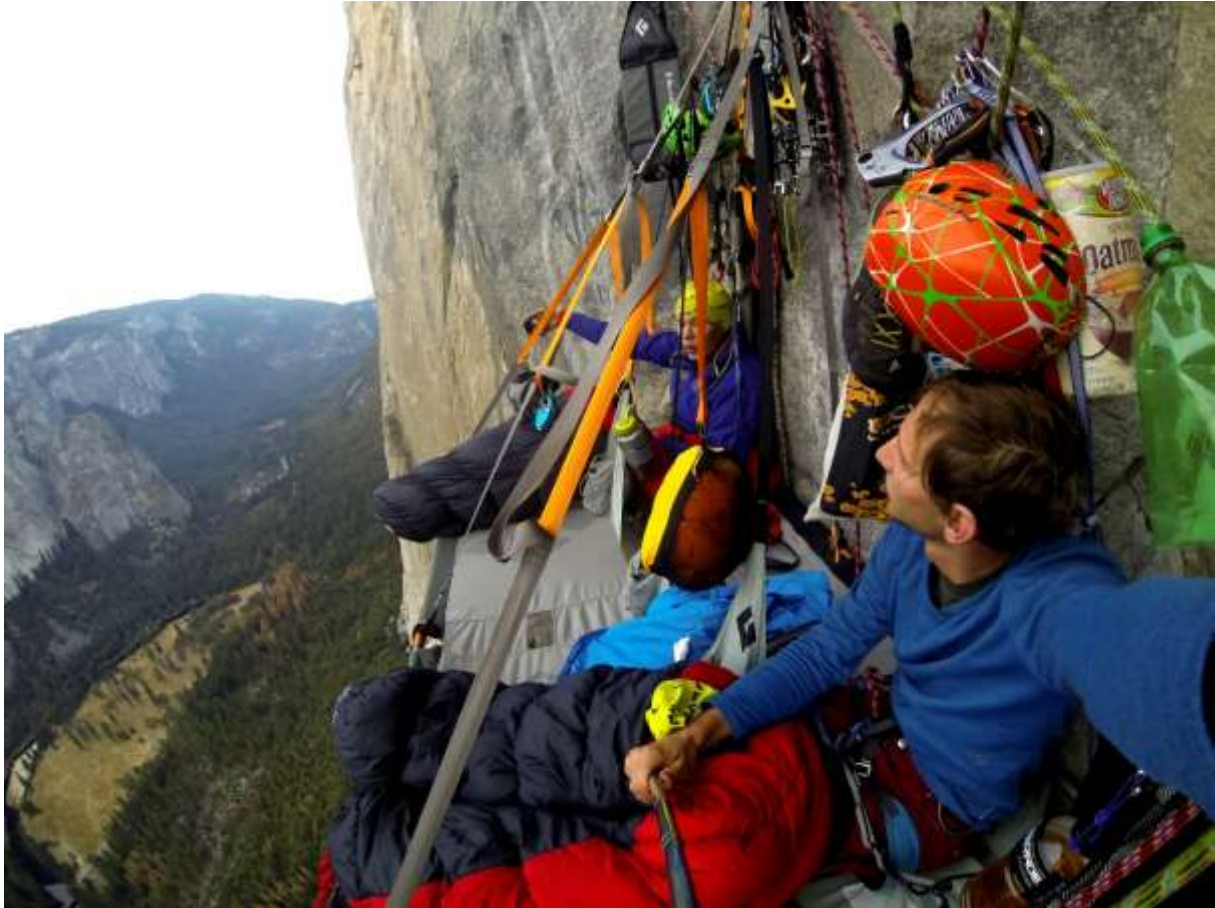
Zdjęcie 1. Jeden z biwaków podczas przejścia drogi Zodiac.