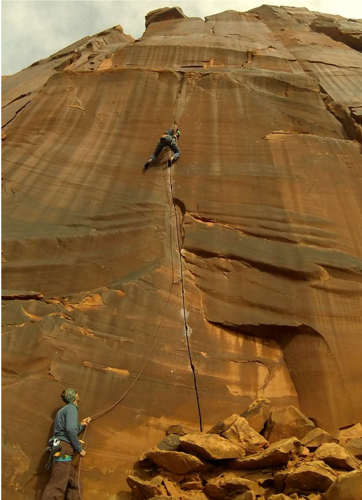
Zdjęcie 2. Wspinanie na drodze Middle Crack w Indian Creek.