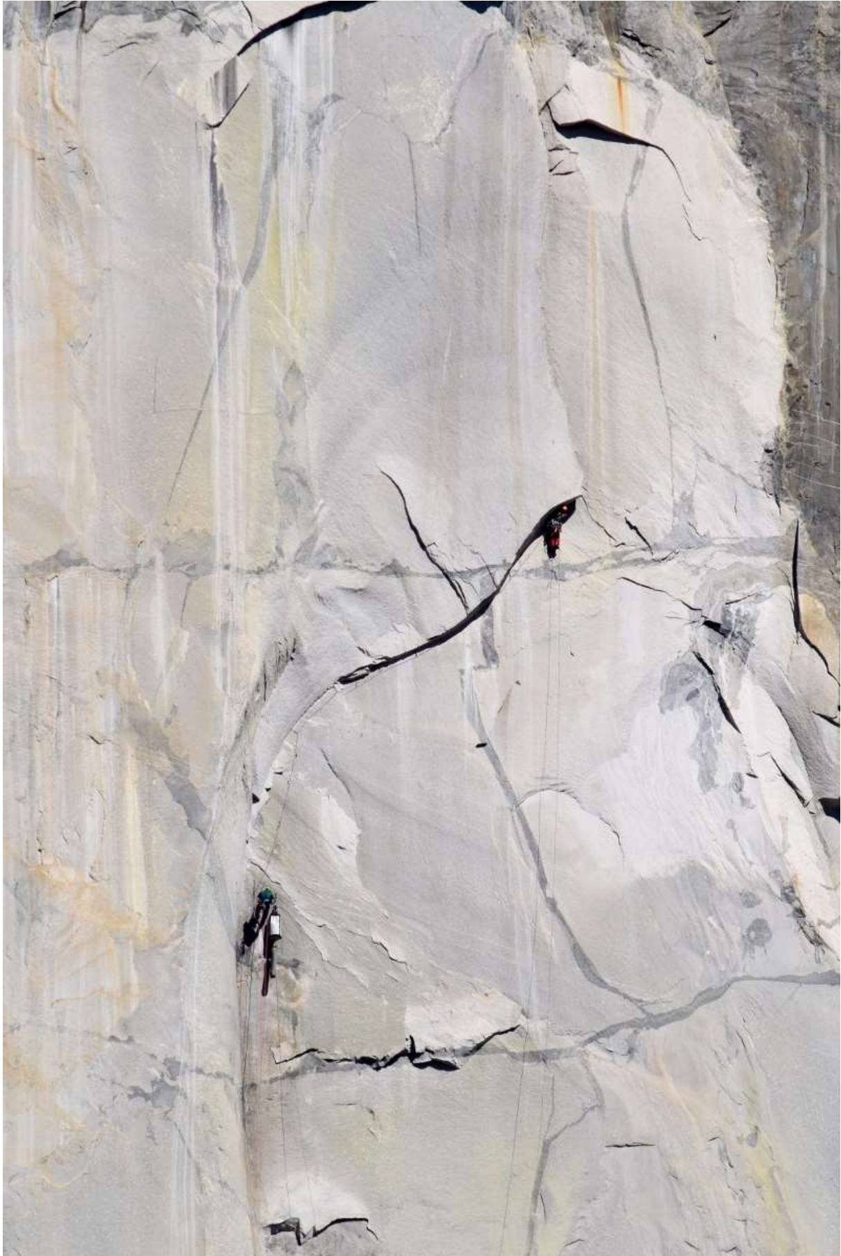
Zdjęcie 7. Sław ek podczas prowadzenia „The Nipple” na Zodiaku.