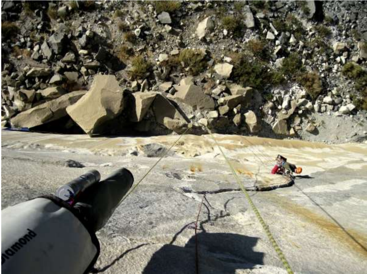
Zdjęcie 4. Sławek podczas czyszczenia pierwszego wyciągu drogi Zenyatta Mondatta.