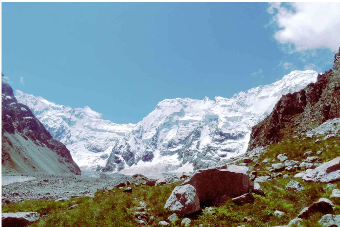
Filar Miżirgi. Z prawej strony szczyt Dych Tau (5204m).

przejście drogi Szwarcgrubera (5A) na ścianie Dżangi Tau (5051m) .