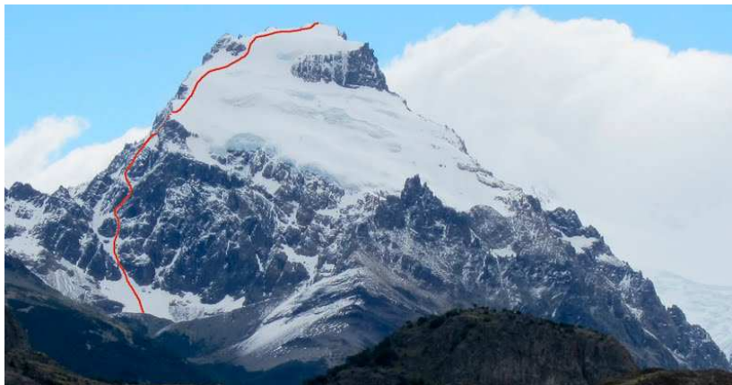
Insomnia na Cerro Solo

Innym celem może być droga Falcone/San Vicente(Insomnia) (ok.2000m, M3, 50°) na Cerro Solo, droga bardzo długa, pozbawiona haków i stanowisk, ale w górnej części łącząca się z drogą normalną na ten szczyt i przy dobrych warunkach śnieżno-lodowych niewymagająca technicznie. Według naszych informacji droga nie ma jeszcze polskiego przejścia.