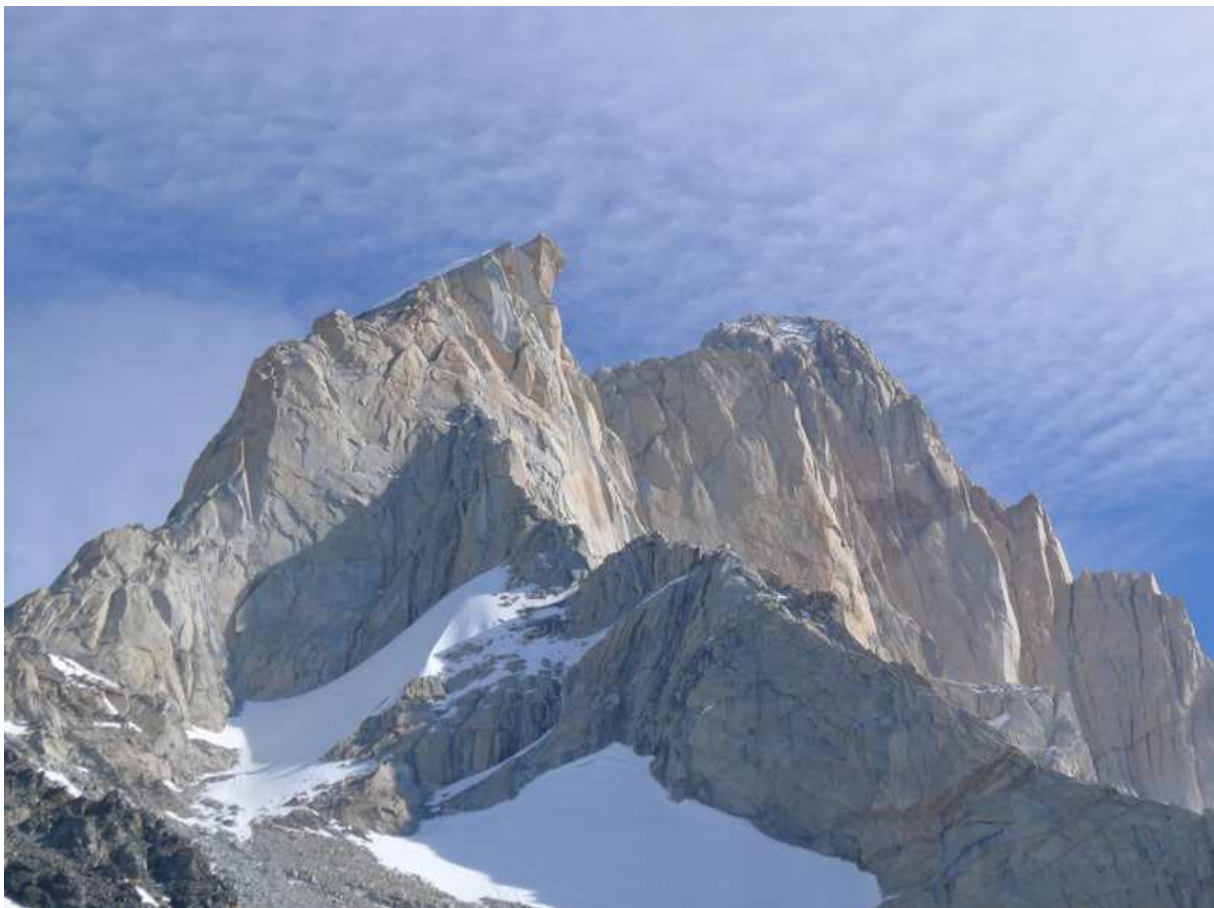
Aguja Guillaumet i Fitz Roy, zdj. Ze strony planetmountain.com

Jeśli okaże się, że warunki w ścianach są dobre, a skała jest względnie sucha to zaatakujemy dłuższą linię na poważniejszej ścianie. W rejonie jest dużo dróg o trudnościach VI-VII i długości ok 600-800m, które przy dobrych warunkach powinny być dla nas możliwe do pokonania w jeden dzień. Ewentualny cel dostosujemy jednak do warunków zastanych na miejscu i informacji uzyskanych od innych wspinaczy. Bierzemy oczywiście pod uwagę opcję wspinaczki z biwakiem, jeśli tylko prognozy dawałaby szansę na dwa dni stabilnej pogody.