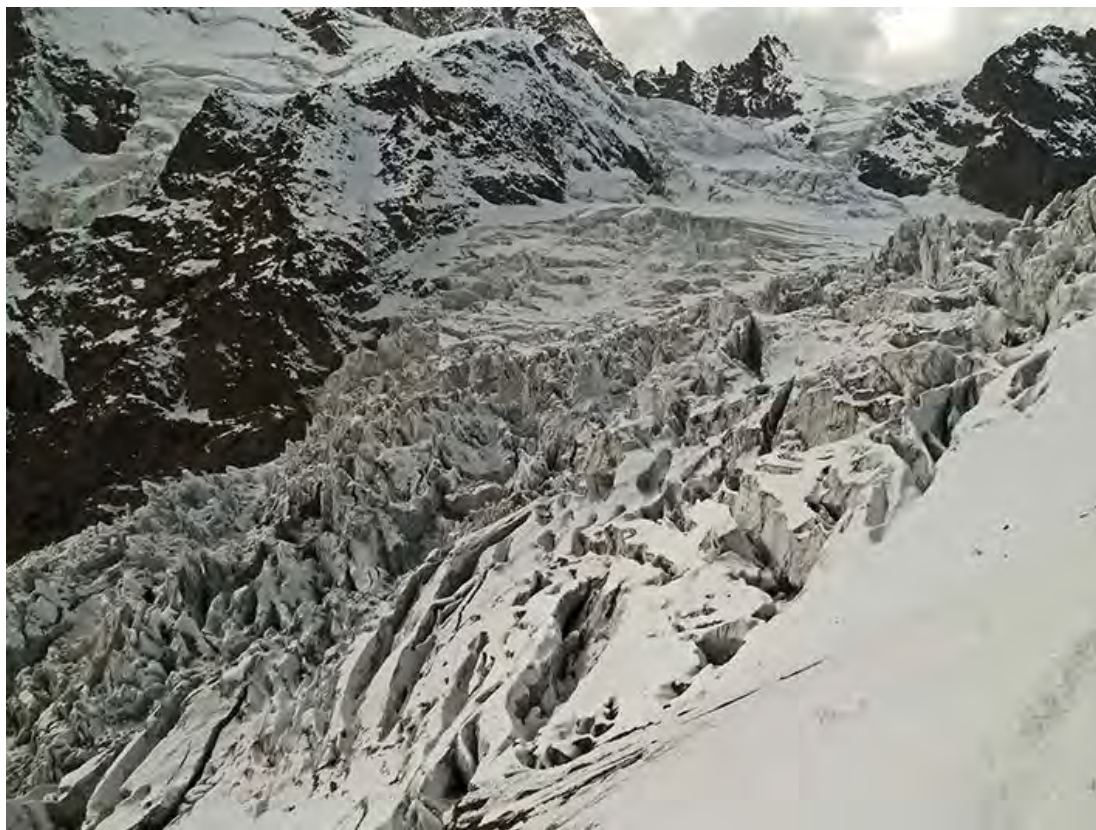
2 i 3 stopień lodowca Chalati (2014)

Lodowiec Chalati to jeden z najbardziej skomplikowanych lodowców kaukaskich, którego przejście można potraktować jako jeden z etapów wspinaczki na Chatyn-tau. Dobrze rozpoznane przejścia kolejnych stopni lodowca, z poprzednich lat, znacznie ułatwią podejście pod nasz cel.