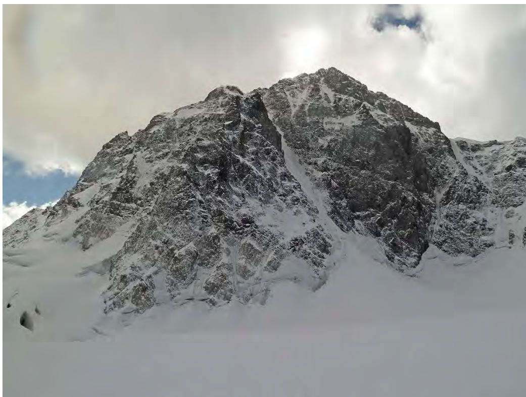
Ściana "romba" widziana z biwaku na czwartym piętrze lodowca Czalaty (2014)

Ściana "romba" to około 600-700 m, pionowego, często przewieszzonego, terenu skalnego. Do jej pokonania potrzebne są dobre umiejętności wspinaczki na własnej asekuracji oraz sprawne poruszanie się techniką hakową. Powyżej "romba" teren zamienia się na mikstowy (kolejne 700-800 m) o znacznie mniejszym nagromadzeniu trudności. Wspinaczka kończy się trawersem grani pomiędzy zachodnim a głównym wierzchołkiem Chatyn-tau