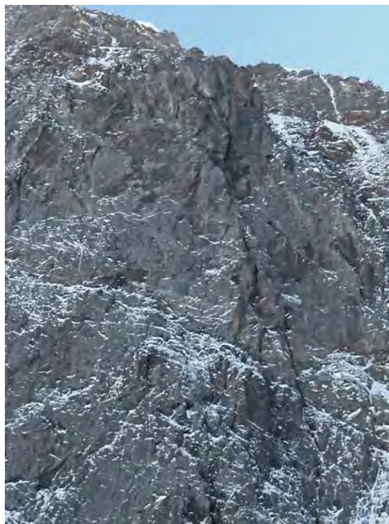
"kominowe" formacje drogi Myszlajewa w dolnej i górnej części "romba"