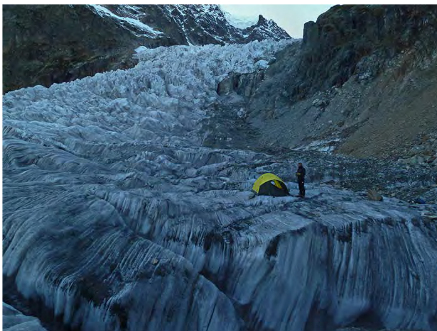
Biwak pod pierwszym stopniem lodowca Chalati (2014)

Priorytetem jest dobrze dobrany skład wyprawy, który powinien charakteryzować się dużą wszechstronnością i zbliżonymi umiejętnościami aby efektywnie poruszać się w ścianie. Bardzo ważny jest dla nas styl samego przejścia ale ponad "klasykę", o którą będziemy walczyć,