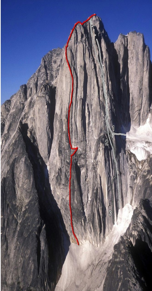
Przybliż przebieg głównego celu wyprawy "All along the watchtower" zach. ściana płn. Howsera.