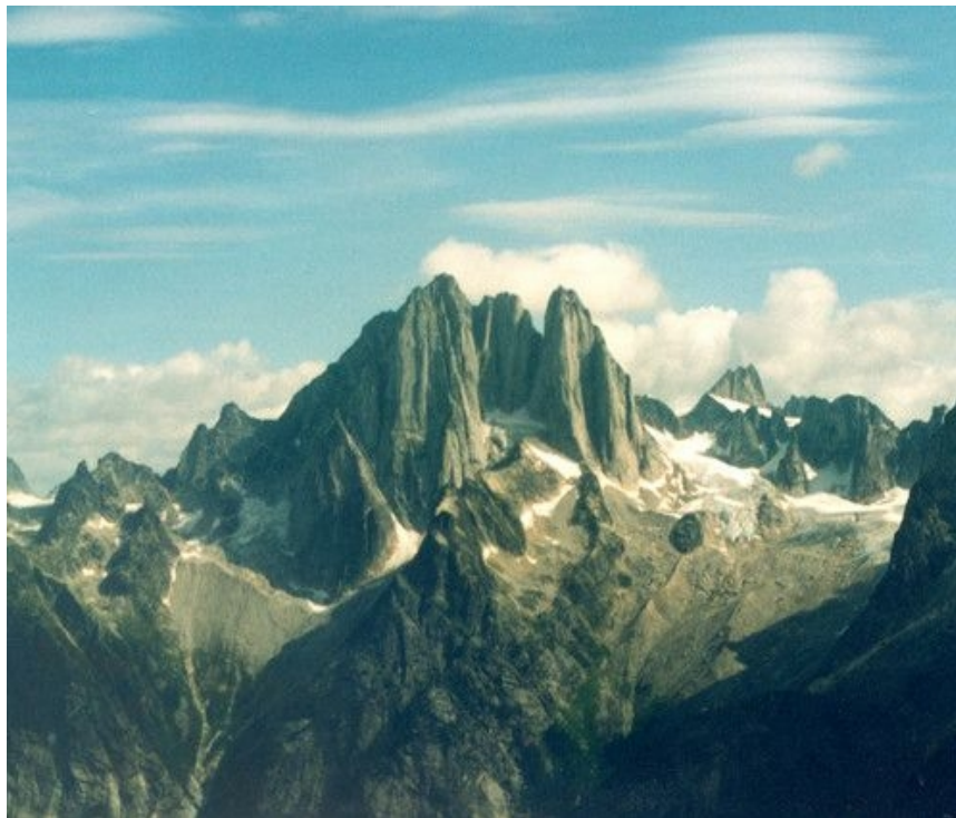
Turnie Howsera od zachodu.

Głównym celem jest najwyższa ze ścian rejonu - 900 metrowa zachodnia ściana północnej turni Howsera (North Howser Tower, 3399 m) drogą “All along the watchtower” (5.12-/7b, 30wyc.)