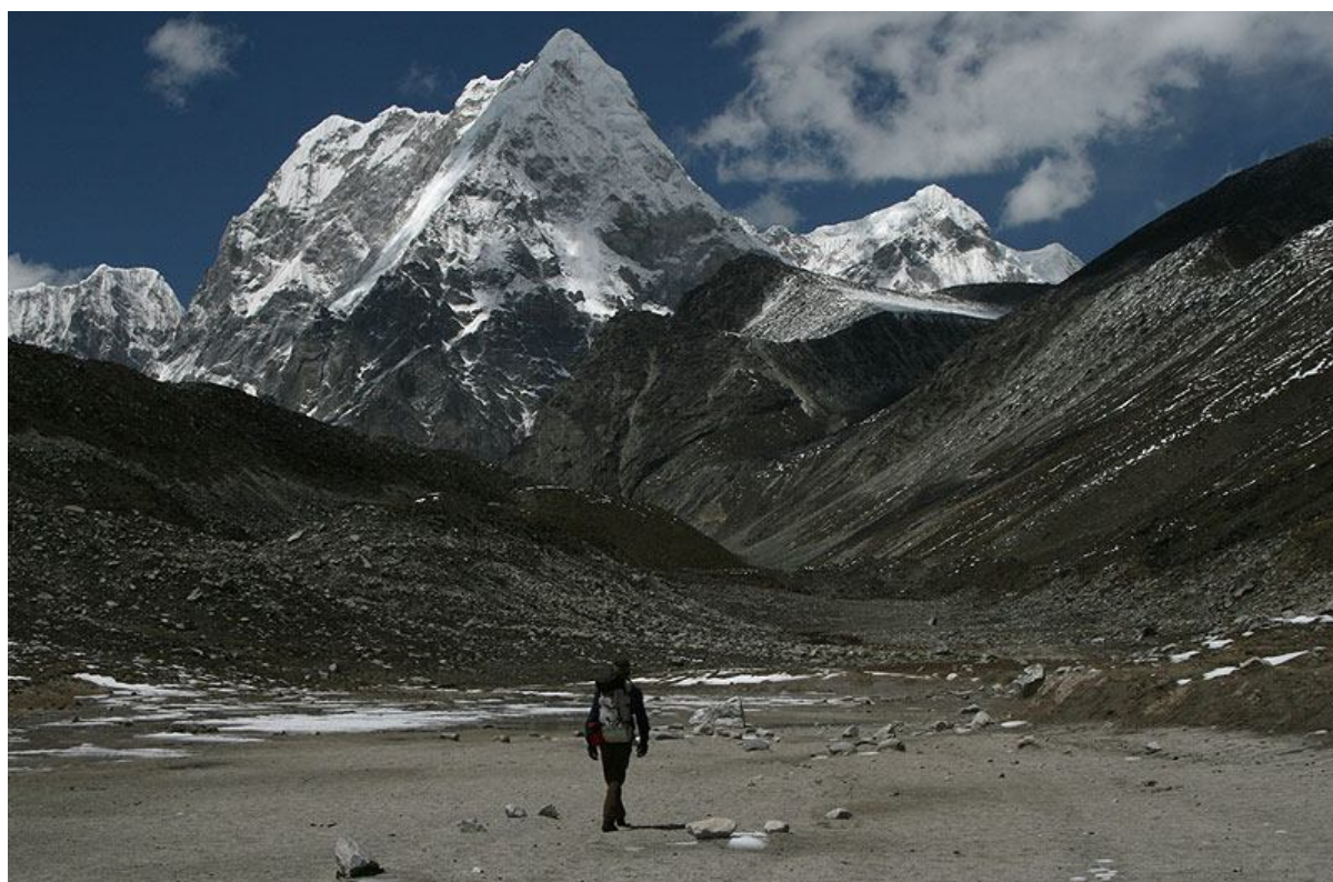
Wschodnia ściana Jobo Rinjang 6778m.n.p.m – jeden z celów wyprawy