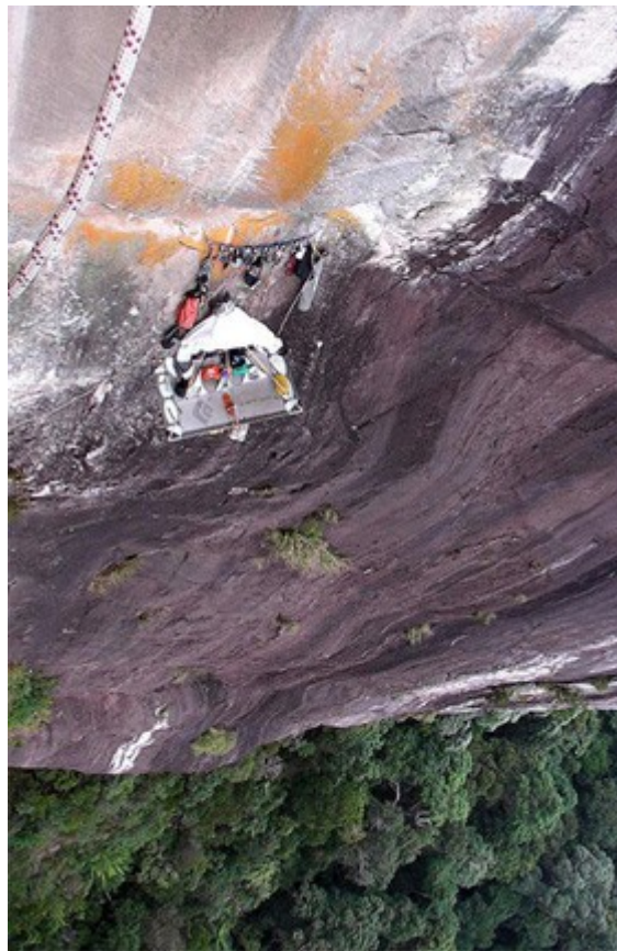
Wgląd z Wielkiego Okapu w zachodnią ścianę Dragon's Horns

Wybrana przez nich linia oferowała wyzwanie w postaci 12 metrowego dachu ochrzczonego przez wspinaczy "The Great Roof". Dotarcie pod ścianę i transport worów przez dżunglę zajęło im 16 dni.