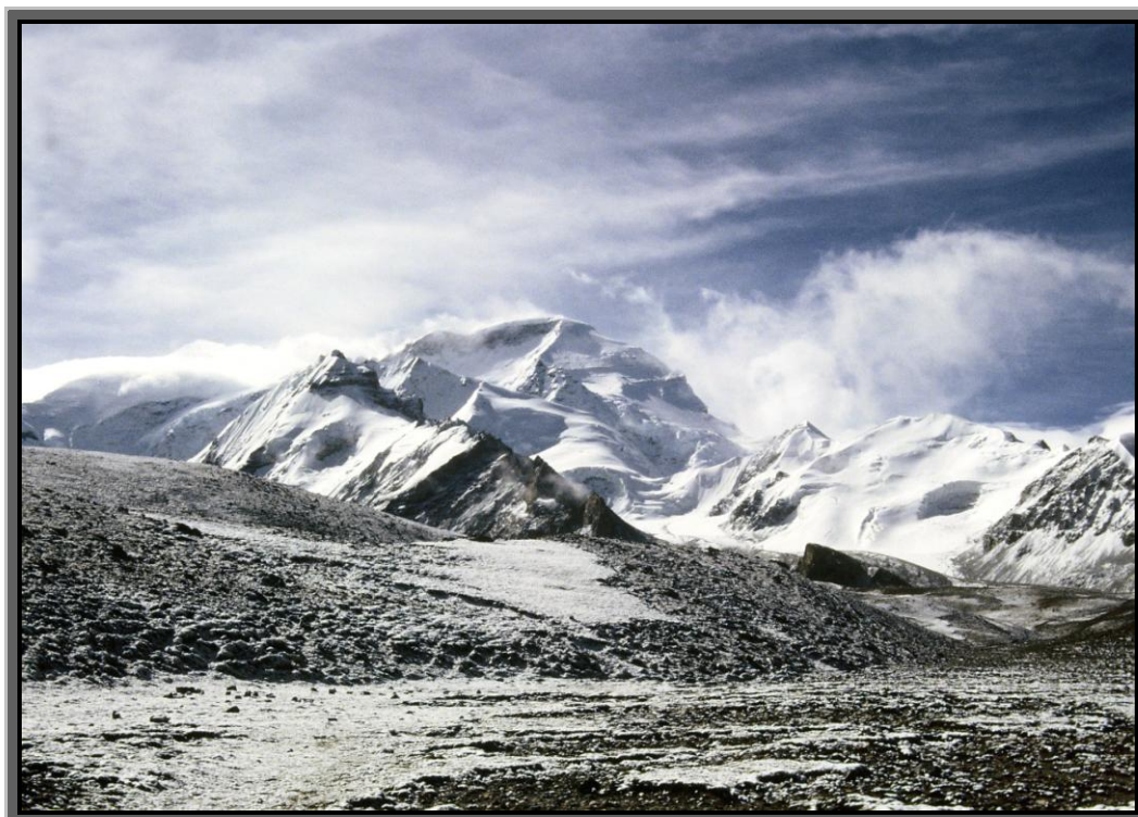
Rejon Cho Oyu