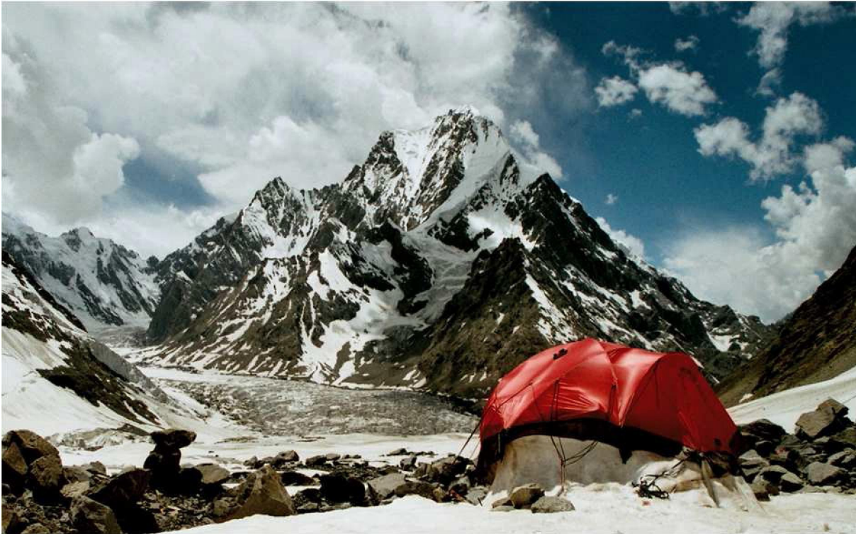
Fot. 5 wschodnia ściana Karambar Sar

Drugi z interesujących nas szczytów, Karambar Sar, zamierzamy zaatakować od strony wschodniej, z odnogi lodowca Karambar (fot. 5). Znajduje się tam kilka potencjalnych dróg wejścia na szczyt.