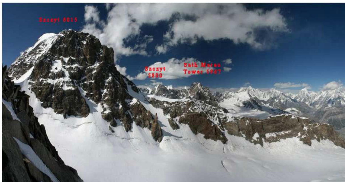
Fot. 7 Szczyty w otoczeniu lodowca Kukuar