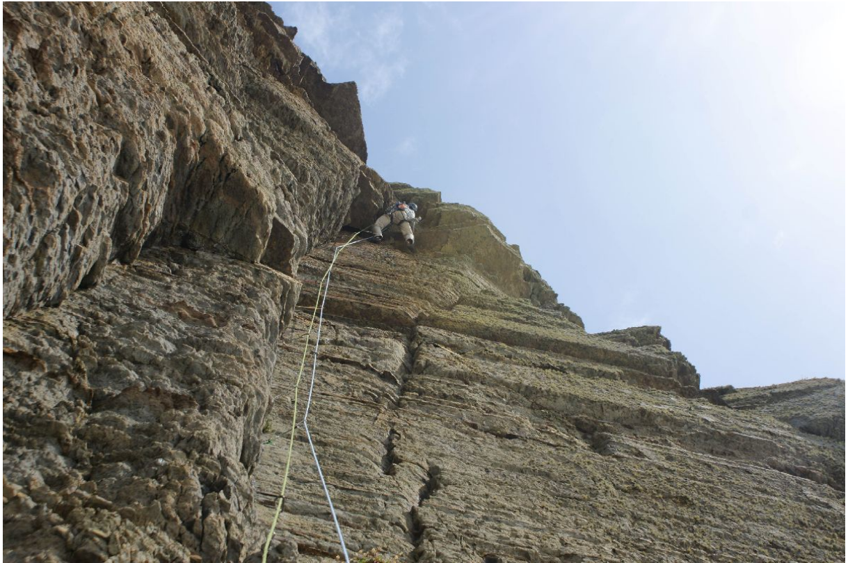
Cripple creek E3 5b