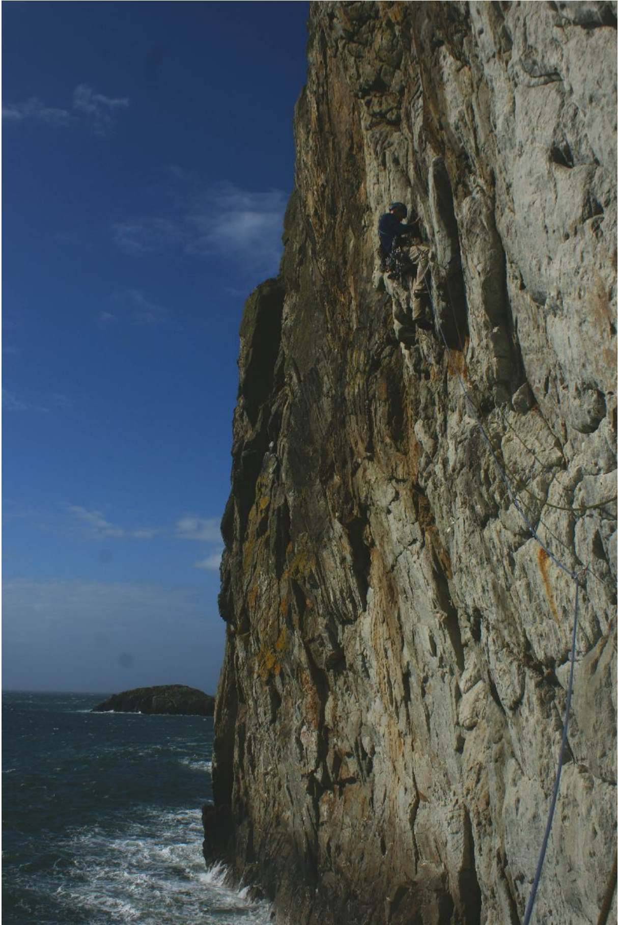
The Rat race E3 5c