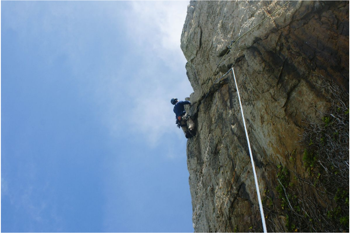
The strike E4 6a