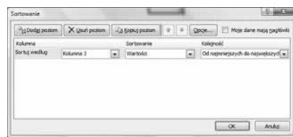
△ Rys. 2. Sortowanie w celu wyizolowania „sztucznych otworów”

wartości najmniejszych do największych. Dzięki tej operacji wszystkie wiersze, którym w kolumnie J przypisane jest '0', znajdują się na górze tabeli.