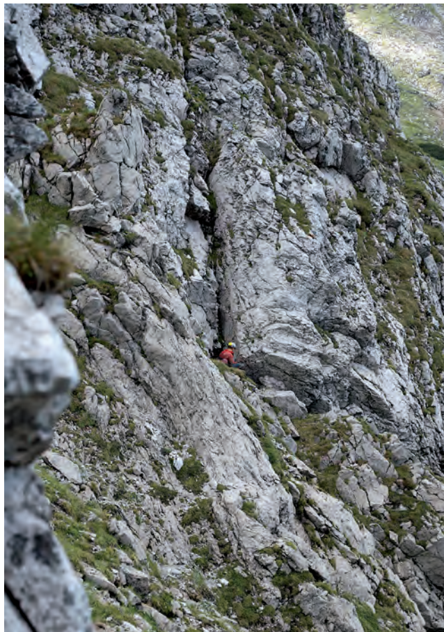
△ Widok z przebiegalni na otwór Koprowej Studni

W latach 2005–2007 z inicjatywy Włodzimierza „Jacoosia” Porębskiego prace inwentaryzacyjne w tej jaskini prowadził Speleoklub Dąbrowa Górnicza. W tym okresie zainstalowano w jaskini stałe punkty asekuracyjne typu „Batinox”. Celem umożliwienia dostępu do korytarza wschodniego otwór jaskini zastąpiono płachtą, w wyniku czego gromadzenie się śniegu na dnie studni wlotowej przestało być problemem. W studni tej na głębokości około 8 m wykonano trawers do wypatrzonego uprzednio okna, za którym odkryto kilkumetrowy ciasny korytarzyk. Usilne próby znalezienia kontynuacji jaskini w zawalisku na jej dnie zakończyły się fiaskiem. Niedopełnienie zobowiązań oraz wymogów formalnych względem TPN skutkowało odmową wydania zezwolenia na ich dalsze prowadzenie i prace te zostały zawieszono. W zaistniałej sytuacji pozostało jedynie posprzątać i tak przy okazji kilku akcji o charakterze sportowym i szkoleniowym wyniesiono z jaskini zdeponowany sprzęt oraz zdemontowano zadaszenie otworu. W czasie jednej z takich akcji odkryto otwór Jaskini Świstaczej. Dnia 10 listopada 2009 roku, przy okazji akcji w Koprowej Studni, zespół grotołazów ze Speleoklubu Dąbrowa Górnicza w składzie: M. Rembecki, ▷