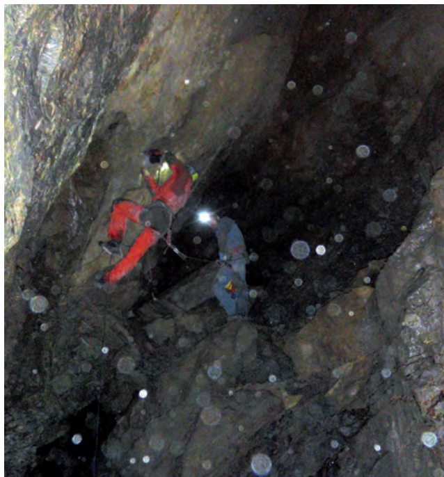
△ widok z dna na półkę pod przewieszonym progiem (Jaskinia Świstacza) – wspinaczka do ciasnego okna, po paru metrach kominek się kończy