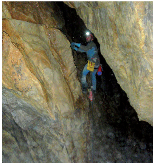
△ Wspinaczka do okna w sali na dnie Jaskini Świstaczej. Okno okazało się ślepe; widok z półki pod przewieszonym progiem