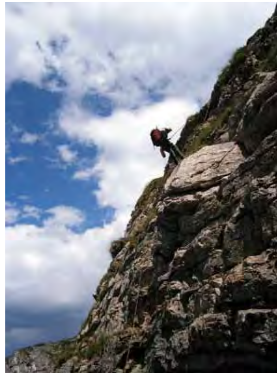
△ Pierwszy zjazd na dojściu

W jaskini jest wilgotno, światło sięga do początku pierwszej trzymetrowej studzienki. Na dole, z końcowej szczeliny wyczuwa się niewielki przewiew. □