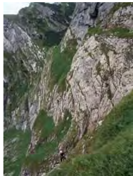
△ Z tego longlifa zjeżdżamy do otworu – w tle widoczny otwór Ptasiej Studni

Początkowo jak do otworu Ptasiej Studni, aż do miejsca, z którego zjeżdżamy na szeroką trawiastą półkę prowadzącą do otworu jaskini. Z trawiastej półki kierujemy się na zachód, aż do stromej, opadającej w dół płyty. Trzydziestopięciometrowym zjazdem dostajemy się do tzw. ścieku w Progu Mułowym, skąd